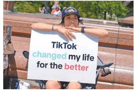
◆TikTok創作者就封殺令提起訴訟。資料圖片

一群TikTok創作者其後於5月14日提起訴訟，尋求阻止「不賣就禁」法令，稱其「對美國人的生活產生深遠影響」。