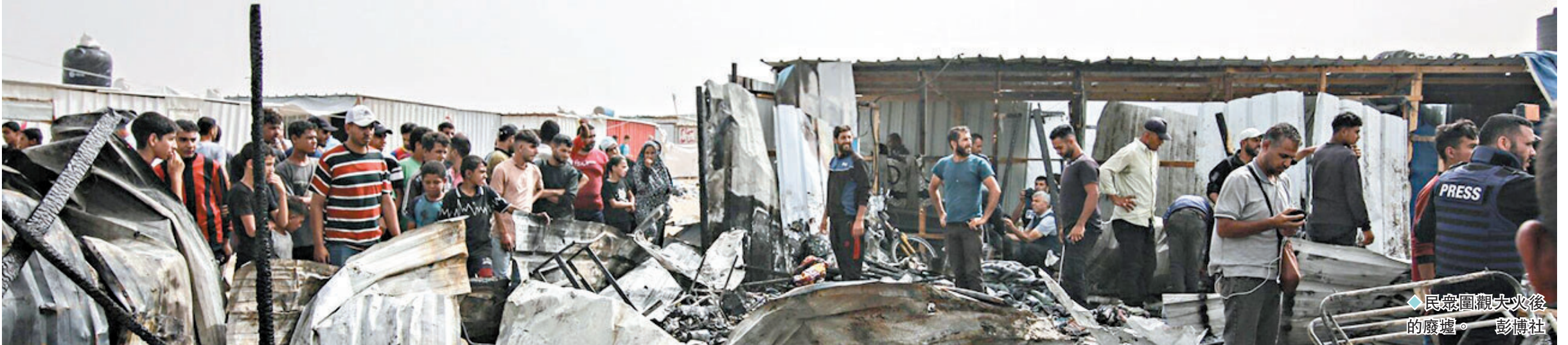
◆民衆圍觀大火後的廢墟。

香港文匯報訊 據加沙地帶的目擊者表示，以色列坦克周二(5月28日)開入加沙南部城市拉法市中心，以軍坦克在進入拉法途中與當地巴勒斯坦武裝人員發生激烈衝突，現場可以聽到劇烈槍聲。消息人士又稱，以軍周二下午轟炸拉法一處難民營，至少造成21人死亡。而以軍在周日(5月26日)晚間報復性襲擊拉法一座難民營，已造成至少45人死亡、249人受傷，許多婦女和兒童被活活燒死，震驚國際社會。