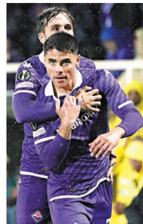
▲費倫天拿連續第二屆殺入決賽。資料圖片

另一方面，費倫天拿是連續第二季殺入歐協聯決賽，球隊上季最終不敵韋斯咸無法捧盃，本屆自然希望成功復仇。然而，費倫天拿看來是一支離開主場便氣勢減弱的球隊，在8強和4強面對柏辛域陀尼亞和布魯日，均只是依靠主場之利過關，未曾在客場取得過優勢；由於今次決賽在希臘舉行，可以預期就算是中立場，但坐在非主客區區域的中立球迷，相信也會是支持奧林比亞高斯較多，因此費倫天拿要「復仇」相信有難度。