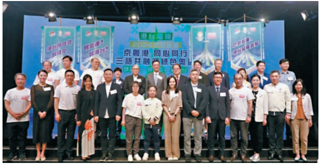
▲一眾嘉賓大合照。

香港社會的熱切期望，成功購入兩個運動會在香港的電視播映權，讓全港市民可以免費觀看巴黎奧運會和殘奧會的賽事。他希望透過轉播巴黎奧運和殘奧會，可以進一步刺激本地餐飲和零售活動，一方面促進經濟，亦發揮乘數效應，讓社會各界各適其適，一同欣賞今年的奧運盛事。