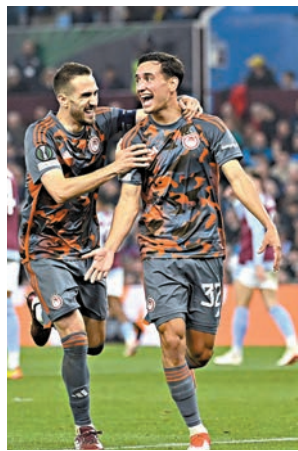
▲奧林比亞高斯近期表現搶鏡。資料圖片