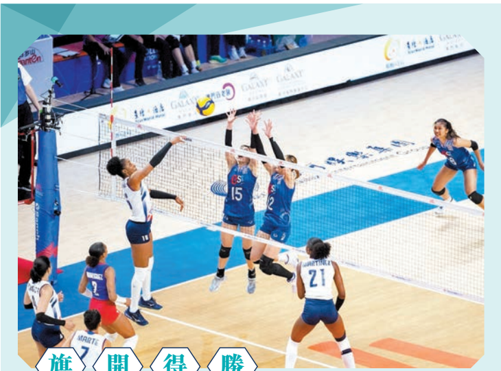
銀河娛樂集團世界女子排球聯賽澳門2024，昨日假銀河綜藝館拉開序幕，泰國隊（藍衫）首戰以3：1擊敗多明尼加隊，在今屆世界女排聯賽旗開得勝。