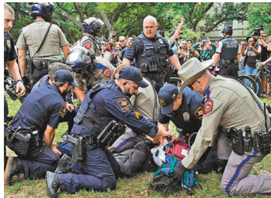
▲一名奧斯汀分校的撐巴示威者被捕。資料圖片