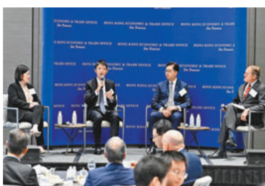
◆金管局助理總裁許懷志（左二）、港交所市場聯席主席蘇盈盈（左一）和數碼港首席公眾使命官陳思源（右二）出席午餐會的專題討論環節。

同一場合的港交所市場聯席主席蘇盈盈表示，港交所正在推動綠色債券上市，該所在4月公布了有關綠色及氣候信息披露規定，以提高上市發行人在這些方面的披露要求。碳排放與