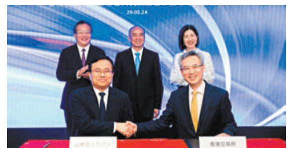
◆港交所內地業務發展主管周健男（前排右），與山東省副省長宋軍繼（前排左）簽訂合作備忘錄。後排右起為港交所行政總裁陳翹庭，山東省委書記、省人大常委會主任林武及山東省委常委、秘書長范波。

合作備忘錄由港交所內地業務發展主管周健男與山東省副省長宋軍繼在香港金融大會堂簽訂。港交所集團行政總裁陳翹庭，山東省省委書記、省人大常委會主任林武，山東省省委常委、秘書長范波見證簽署。山東作為推動中國東部經濟發展的主要省份，近年來積極推動現代農業、食品科技、生物科技等新興產業發展。截至今年4月底，在香港交易所主板上市的山東企業共有55家，融資總額超過720億港元。