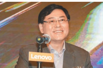
◆聯想楊元慶表示，集團計劃在沙特新建一個技術與製造基地。

香港文匯報訊 聯想集團（0992）昨日宣布，與沙特阿拉伯公共投資基金旗下公司Alat埃耐特達成戰略合作框架協議和簽訂20億美元無息可換股債券協議債券認購協議。