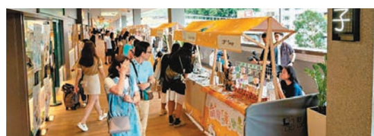
◆沙田好運中心引入人氣餐飲品牌之餘，亦定期舉辦市集吸引市民留港消費。

華懋又表示，翻新後的好運中心將定期舉辦期間限定市集，推廣本土特色小店。另外，為鼓勵市民留港消費，顧客凡於5月31日至6月底期間，每逢星期五及公眾假期於商場餐廳單次消費滿250元，即可於「CCG Hearts 如心賞」手機應用程式換領50元電子餐飲禮券。