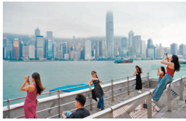
▲天文台指南海低壓區勢發展成熱帶低氣壓。

內地中央氣象台及日本氣象廳發出的熱帶氣旋移動路徑概率圖，大致都料該熱帶低氣壓會先向北移動，在珠江口西部登陸，並有可能掠過廣州一帶，後在內陸轉向東趨向福建廈門至福州，有颱風網站的移動路徑概率圖顯示，該熱帶氣旋會再出海經過台灣海峽，吹襲台灣地區。