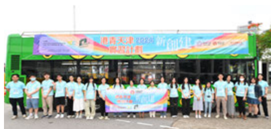
「新創建」學員巴士遊。