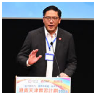
民政及青年事務局副局長梁宏正致辭。

通過此實習計劃，學員們將得以深入了解國家的發展方向和社會實況，進一步加強對國家偉大發展的認識，並通過親身體驗拓寬視野，探索天津這一歷史悠久且文化資源豐富的地區，了解其最新的發展趨勢。這將為他們未來更好地融入國家發展大局和社會發展做好充分的準備。「港青天津實習計劃2024」不僅為學員提供了一個寶貴的學習和成長的機會，同時也是一個促進職業發展和文化理解的重要平台。蔡關穎琴表示，期待着每一位學員都能在此次實習中獲得豐富的經驗，並將所學應用於未來的學術和職業道路上，共同為社會的進步與發展作出貢獻。