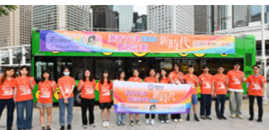
「新時代」學員巴士遊。