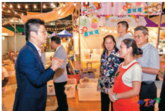
◆有參展檔主感謝特區政府搭建平台讓他們經營小本生意。

「龍騰觀塘仲夏夜市」屬於「日夜都繽紛@觀塘區」的活動，是今年初同系列夜市「龍騰觀塘新春夜市」的延續。活動由觀塘民政事務處、觀塘區議會和香港觀塘工商業聯合會（觀塘工商聯）合辦。本次夜市於29日閉幕，主辦方舉行了閉幕儀式，由觀塘民政事務專員、觀塘工商聯會長和商戶代表致辭。嘉賓逐一答謝商戶，現場氣氛良好。