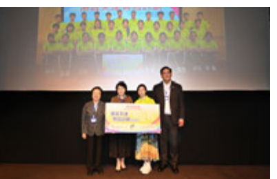
梁宏正授旗予「新征程」的學員代表。