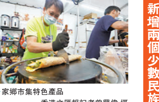
◆家鄉市集特色產品

家鄉市集各地特色產品 廣東：56個攤位包括潮汕的浦水鵝、綠豆餅，茂名高州龍眼乾、小黃魚 福建：21個攤位當中包括4個熱食攤位，多達200種貨品，總值600萬元，包括原味雞爪、街口花生、武夷山大紅袍 廣西：香栗10元一包，20元三包，龜苓膏、螺粉 貴州：總值40萬元貨品，主打茅台酒，較平時便宜300至500元，還有中藥材包括金靈芝，以及宣傳貴州「村超」足球，更突出身穿民族服裝的少數民族女子宣傳貴州 安徽：非遺文化包括文房四寶、阜陽剪紙表演、黃梅戲折子戲《女附馬》表演。特產包括古井貢酒、黃山折門紅茶、黃山毛峰、六安瓜片、黃山太平猴魁等 湖北：3個攤位共帶來100個種類貨品，包括辣味鴨舌、泡藕帶、純藕粉 河南：多達60種貨品，總值20多萬元，主打「好想你」系列食品，如小派菓仁派、老少咸宜