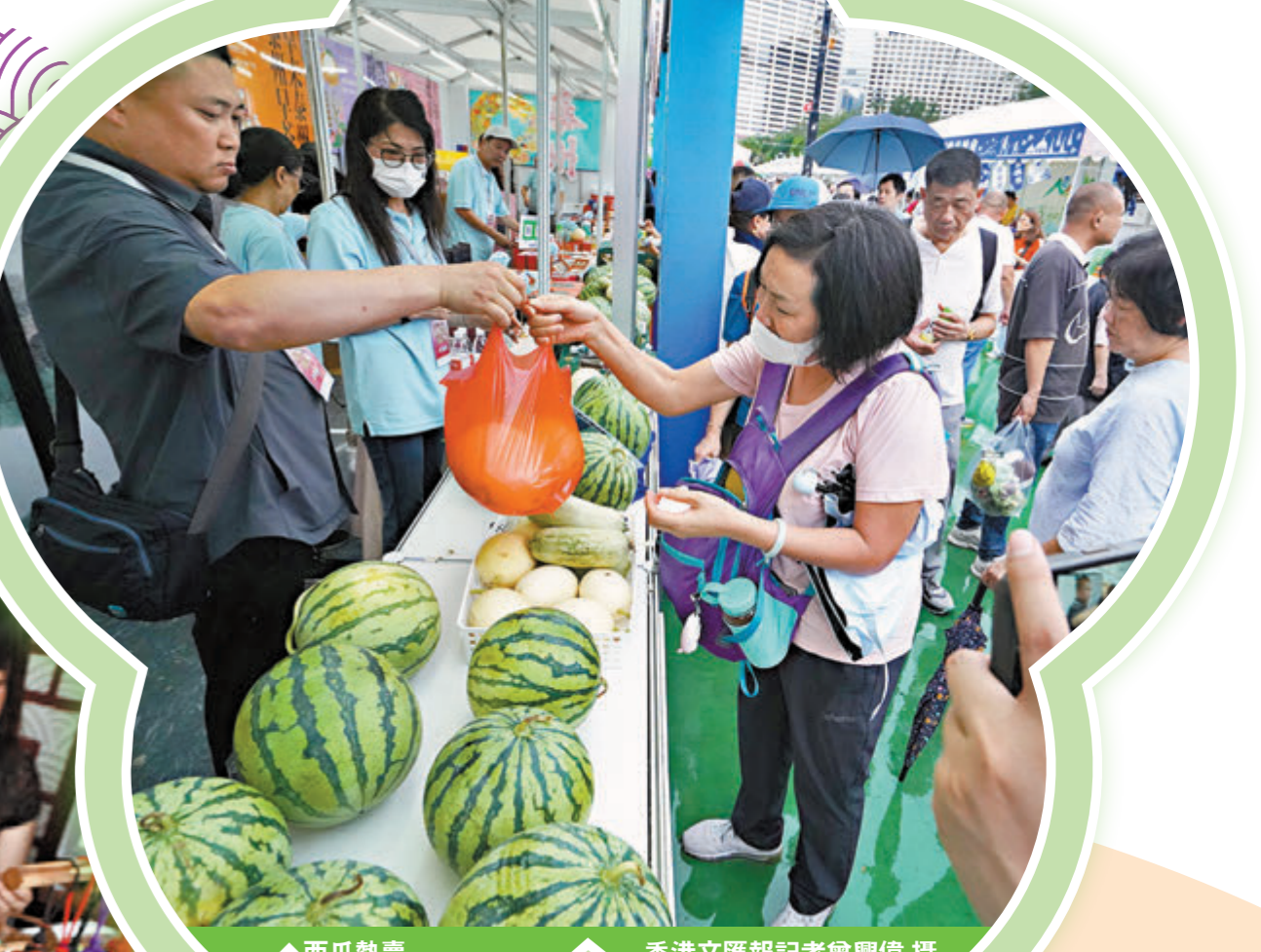
◆西瓜熱賣