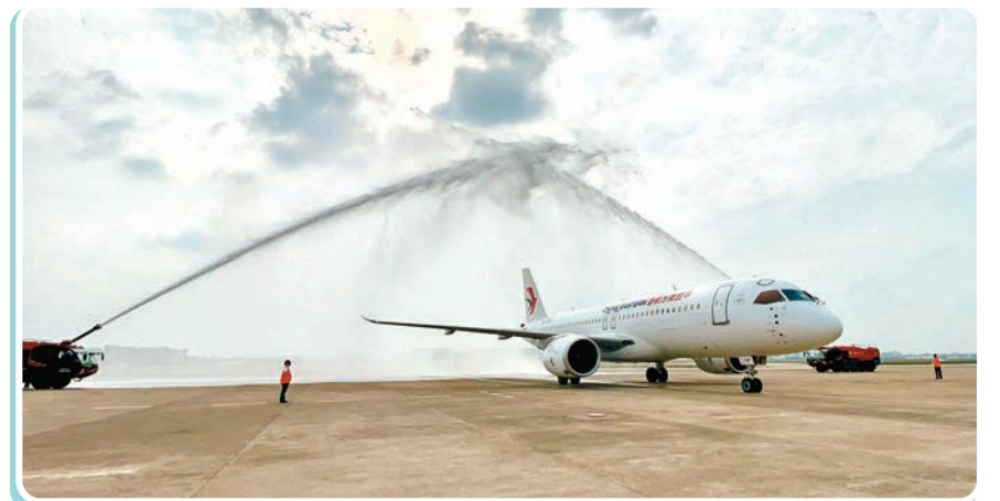
▲上海虹橋國際機場以水門儀式迎接C919從香港飛抵上海。