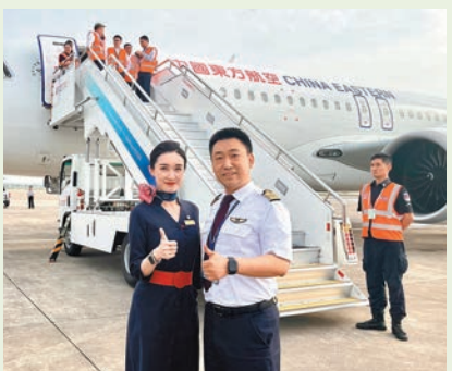
◆機長與乘務長飛抵上海後在機前留影。

香港文匯報訊（記者 夏微 上海報道）能夠參與C919首次跨境商業航線的飛行，不僅乘客倍感榮幸，機組人員也深感自豪。作為本次航班的機