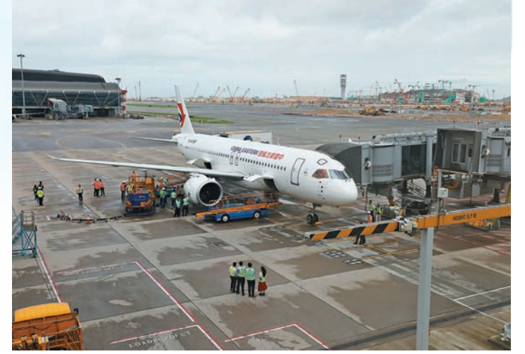
▲昨天上午，C919飛抵香港接載港生，眾人難掩興奮之情。