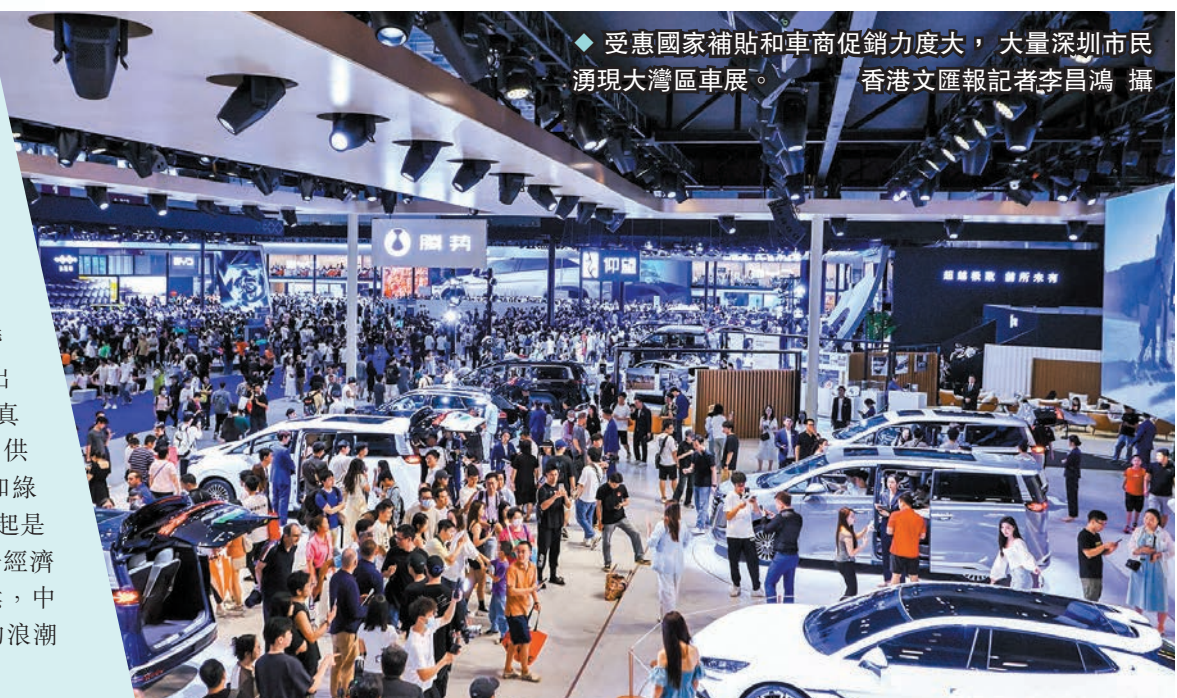
◆受惠國家補貼和車商促銷力度大，大量深圳市民湧現大灣區車展。