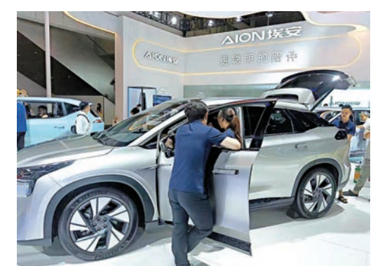
▲許多參觀人士觀看廣汽埃安新能源車

在蔚來展位，記者看到8款2024車型集中亮相。現場銷售員表示，他們展示的純電車售