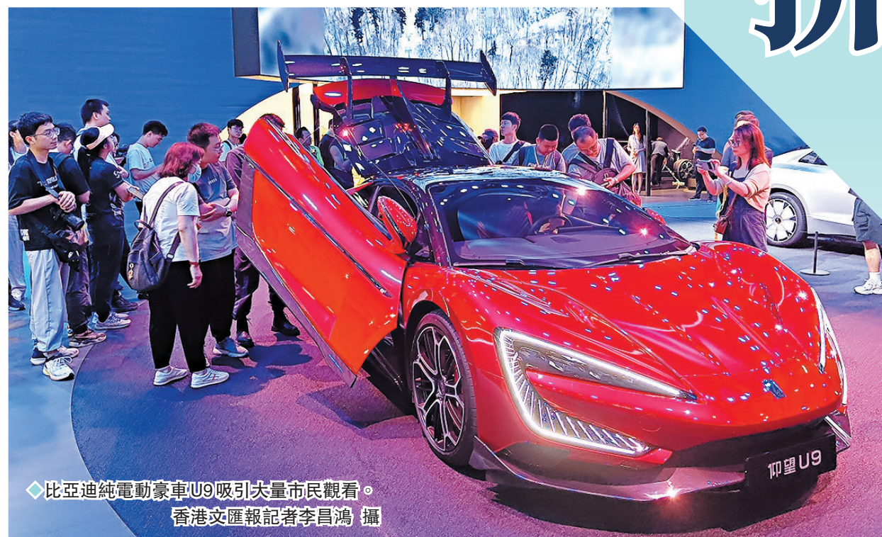
◆比亞迪純電動豪華車U9吸引大量市民觀看。

雷軍也在展會上表示，智能化是智能電動汽車的靈魂，是汽車工業的必爭高地。據他介紹，小米汽車智能駕駛的智駕活躍率83.18%，智駕里程362.86萬公里。小米汽車上市兩個月以來，4-5月份分別交付了7,058輛和8,630輛。6月份開始小米汽車工廠開始開雙班生產，以滿足客戶需求。小米從第一天起就是十倍投入汽車創新和研發，認認真真聚精會神做好一輛車，並鎖定核心技術賽道，從核心技術做起。雷軍現場發起倡議，希望行業能夠共建共享生態，統一標準，以避免不必要重複和浪費，中國汽車也會越來越好用。