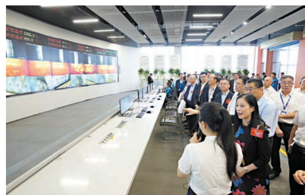
◆調研組參觀廣州第四資源熱力電廠。

香港文匯報訊(大公文匯全媒體記者 義昊 廣州報道)港區全國人大代表赴穗專題調研座談會昨日上午在廣州南沙舉行，多名代表圍繞完善粵港澳大灣區規則銜接機制，建立灣區標準提出建議，希望通過三地政府合作尋求新的發展空間。