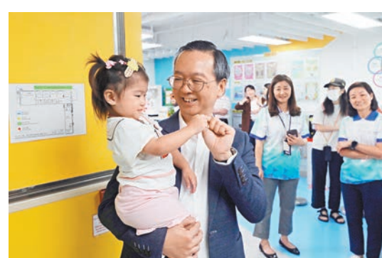
◆戴尚誠日前探訪「同心村」，並和居民交流。

曾住在「同心村」，其中182個租戶已成功獲配公營房屋。目前，新界區的過渡性房屋項目的入住率平均超過96%，長期受歡迎的市區項目入住情況亦十分理想，平均約93%單位已經流轉供第二批居民入住，個別項目單位使用率達119%。