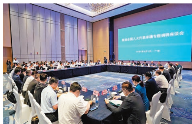
◆代表出席專題調研座談會。