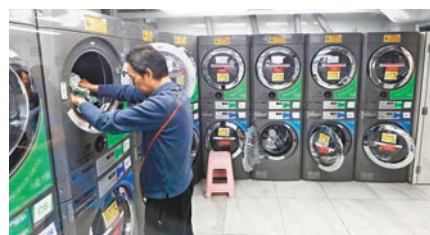
◆「同心村」內生活配套設施齊全。