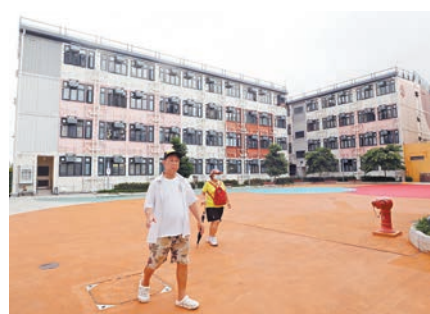
◆「同心村」入住率由起初的僅一半，升至近期97%。