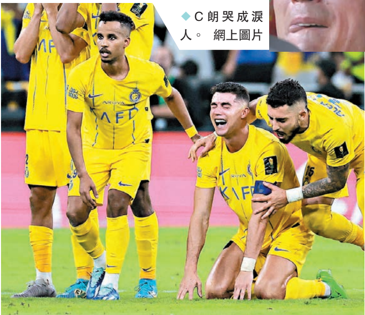
◆艾納斯互射12碼落敗，C朗(右二)傷心跪地痛哭。

可是連同加時艾納斯都把握不到「10對9」的優勢，以1：1進入互射12碼，最後保奴救出兩球助希拉爾贏5：4蟬聯冠軍。C朗加盟艾納斯後連續兩屆沙特職聯都屈居亞軍，今次又與獎盃擦身而過，賽後葡萄牙「球王」更傷心得哭成淚人。C朗上次捧盃是去年的阿拉伯冠軍球會盃，再之前已是2021年在祖雲達斯時的意大利盃，對於已經39歲的C朗來說，又剩下多少時間可讓這位足球巨星再次追逐冠軍呢？