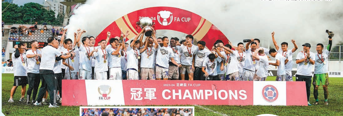
◆東方成為本屆足總盃最終王者。

足總盃決賽昨日在旺角大球場上演，由東方對深水埗，最終東方憑高素巴耶夫建功及巴科爾梅開二度，以3：2險勝深水埗，相隔4年再奪足總盃冠軍。而足總主席霍啟山賽後向傳媒透露，東方主教練盧比度將在未來兩場世界盃外圍賽出任港足助教。 ◆香港文匯報記者 張發兒