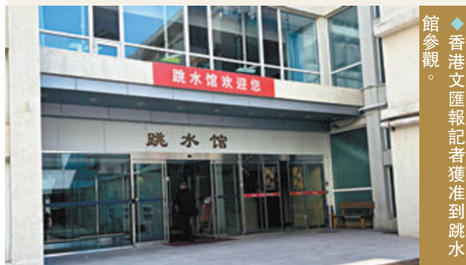
◆香港文匯報記者獲准到跳水館參觀。

在國家體育總局訓練局跳水館近距離觀看他們的訓練，每個動作都是流暢而且具力量的。運動員代表國家榮譽，為國爭光努力和犧牲，能夠近距離觀看他們訓練和面對面交流真的令小記感到自豪。