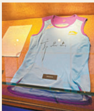
▶榮譽館內有郭晶晶穿着過的訓練T恤。