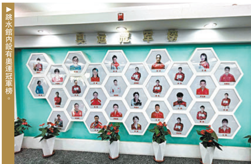
▶跳水館內設有奧運冠軍榜。