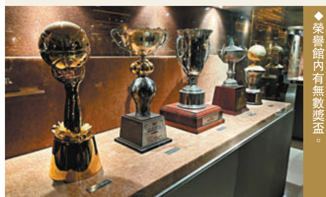
◆榮譽館內有無數獎盃。