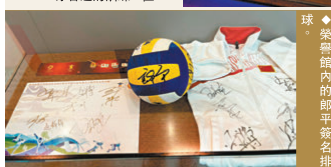
◆榮譽館內的郎平簽名排球。