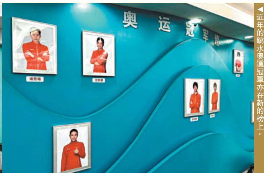
▶近年的跳水奧運冠軍亦在新的榜上。