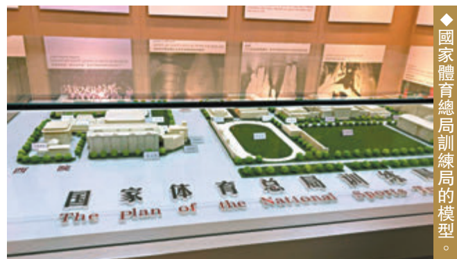
◆國家體育總局訓練局的模型。