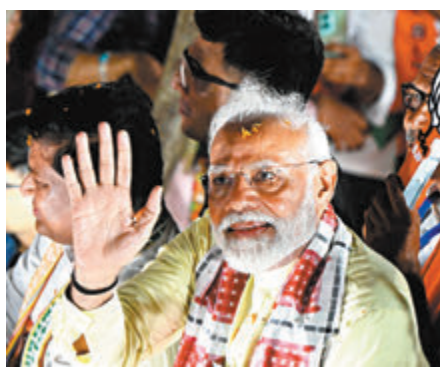
◆莫迪可望贏得第三個5年總理任期。

共分7階段進行，結果將於周二公布。莫迪在社媒上表示，「我可以自信地說，印度人民以創紀錄的選票，重新選舉了全國民主聯盟政府，他們看到了我們的成績，也看到了我們的工作如何為窮人、邊緣化群體和受壓迫者的生活帶來質的改變。」若結果與民調數據一致，莫迪將是自印度開國總理尼赫魯以來，首名總理能連續三屆執政。經濟學家預計，選舉結果將提振印度金融市場，「這將表明政策的連續性，如經濟改革、基礎建設和財政政策等方面。」