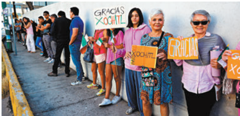
◆墨西哥民眾排隊等候投票。

分析認為，欣鮑姆繼承了洛佩斯的巨大影響力，她承諾會延續洛佩斯的社福計劃，並增加對基建的投資，但能源工