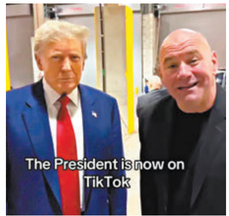
◆特朗普左首條影片，是在新澤西州終極格鬥冠軍賽活動時拍攝。

據一名TikTok人員稱，這款應用程式對特朗普的競選活動極具吸引力，該平台上支持特朗普和支持拜登的內容比例約為二比一。《紐約時報》上月也引述TikTok內部分析稱，早在特朗普還未加入TikTok前，自去年11月以來，TikTok上支持特朗普的帖文數量，幾乎是支持拜登的兩倍。