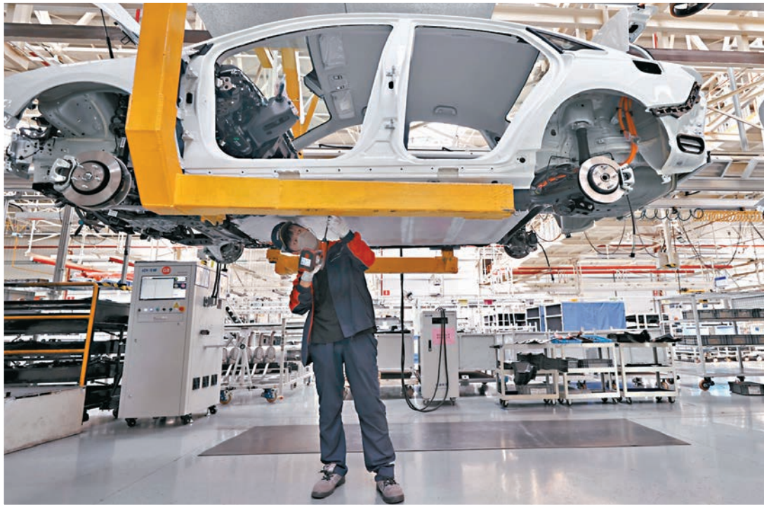
上月財新中國製造業PMI升至近兩年高位