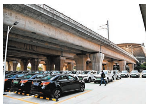
◆廣州市發布小客車指標調控新規，市場料深圳、杭州、北京等地汽車牌照限制有望鬆動。

中央政府希望撬動老舊車主換購新能源乘用車或者低排量燃油車。4月底，商務部、財政部等7部門印發《汽車以舊換新補貼實施細則》，提出在2024年4月26日至2024年12月31日，個人消費者如報廢