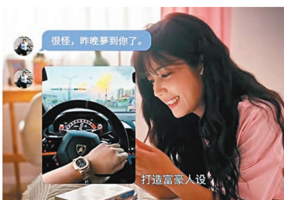
劇中講述女主角的雙胞胎姐妹遇上網絡情緣騙案。