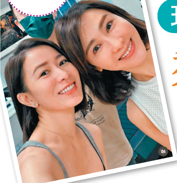
黎姿早前到健身室巧遇余詩曼。