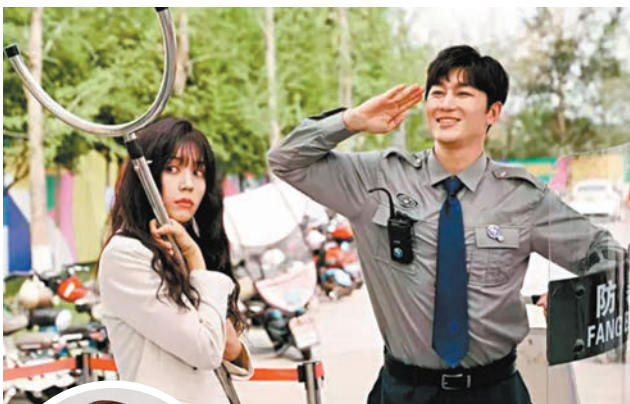
《金豬玉葉》以網絡詐騙案為背景。