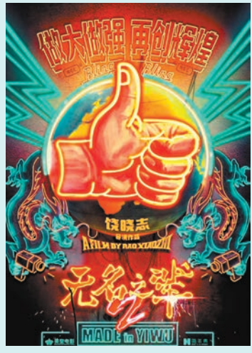
《無名之輩2》由饒曉志執導。