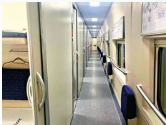
◆動臥列車臥鋪車廂。