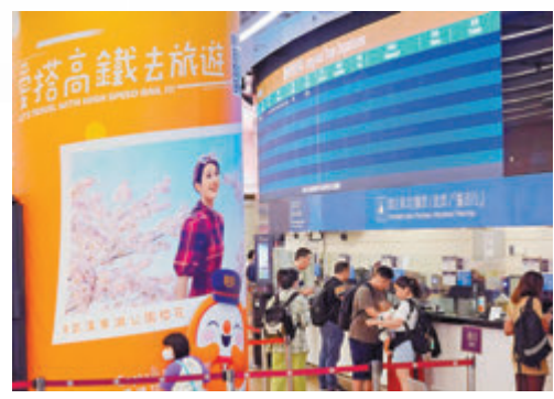
◆來往香港西九龍站與北京及上海的動臥列車車票於今日在多個平台開售。圖為高鐵路西九龍站售票處。

港鐵公司其後公布，來往香港西九龍站與北京及上海的動臥列車車票於今日(5日)中午12時在12306線上票務平台、12306手機App、車站票務櫃位、售票窗口及售票機等各售票渠道開始發售。在新安排下，北京西和上海虹橋兩個站點逢周五至周一每日各有一對來回列車班次，晚上從起始點出發，翌日早上到達，沿途途經石家莊、杭州東等站點。