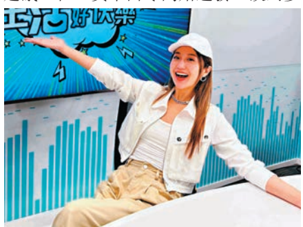
◆支譽儀入行後一直兼顧烘焙店。

至於家人如何支持自己？Venus甜絲絲地說：「我老公好低調，成日唔想上鏡，但佢私下畀我好意見；我媽咪見到有啲報道會話為我驕傲，但覺得呢個圈好浮沉，會提醒我當有咗價值時，就將原有嘅能量去返自己事業。」