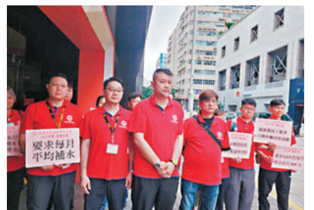
◆汽車交通運輸業總工會九巴及龍運巴士分會要求加薪8%。

九巴表示，公司代表與兩個工會昨日就薪酬調整方案進行會面，解釋了公司的營運狀況和挑戰，以及未來發展，並對工會提出的部分訴求作出回應。公司會繼續與工會及員工保持溝通，坦誠交流，期望達成共識。