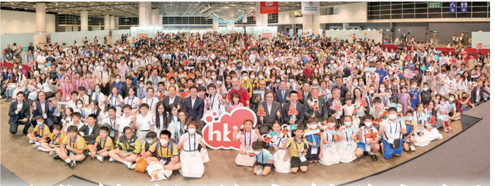
◆第三屆「香港創科展」將於6月8日至9日在會展舉行。