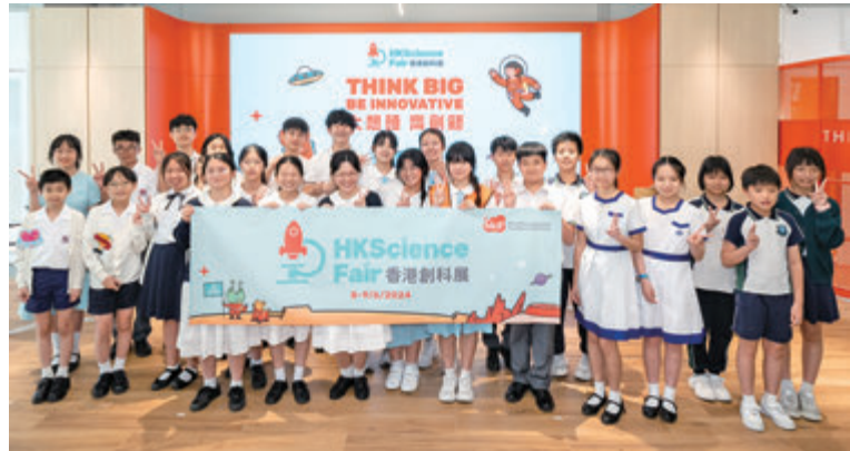
◆今屆創科展匯聚120隊年輕發明家，向公眾展示研究過程及成果。

香港創科展每屆會選出120隊來自本港中小學入圍師生隊伍參與展覽，早前更安排上屆中小學組金獎隊伍遠赴瑞士參加「日內瓦國際發明展」，與世界各地的發明家交流及分享創作理念，助年輕人擴闊國際視野，其中兩項作品更獲銅獎佳績。香港創新基金主席黃永光表示：「在中央政府及香港特區政府對創新科技的堅定支持下，本港創科實力不斷提升並備受國際肯定。香港代表團於今屆『日