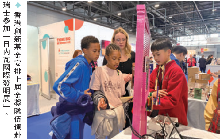
◆香港創新基金安排上屆「金獎隊伍遠赴瑞士參加「日內瓦國際發明展」。

科技創新是國家發展的重要動力，香港特區政府配合國家「十四五」規劃，努力推動創科產業多元化發展，致力打造香港成為國際創科中心，近年社會各界亦積極籌辦各類活動以助帶動創科氛圍。由香港創新基金舉辦、信和集團全力支持的年度盛事「香港創科展」將於本週六日舉行，為中小學生提供展示創意的平台，展出本地大學及專上學院年輕科研團隊的創科成果，還有互動遊戲及工作坊讓公眾探索科技樂趣，去年活動吸引逾20,000人次入場參與，感受本港新一代創科科技力量。