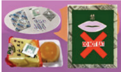
◆ 塑膠新一代，環保障礙物。

防漏包未至於危及生命，如不慎使用，魔力還是不小。有個熱愛珍存文件的朋友就有過「慘痛」經歷，為保文件防漏防蟲蛀，文件箱內放上幾個防漏包，多年後開箱查看，當中有些紙質較為脆弱的文件，由於受不住過分乾燥的影響而變成碎片，最令她痛心的，其中還有珍藏了幾十年她父親的遺書，要是有任何重要證件之類，一定同樣逃不過劫。