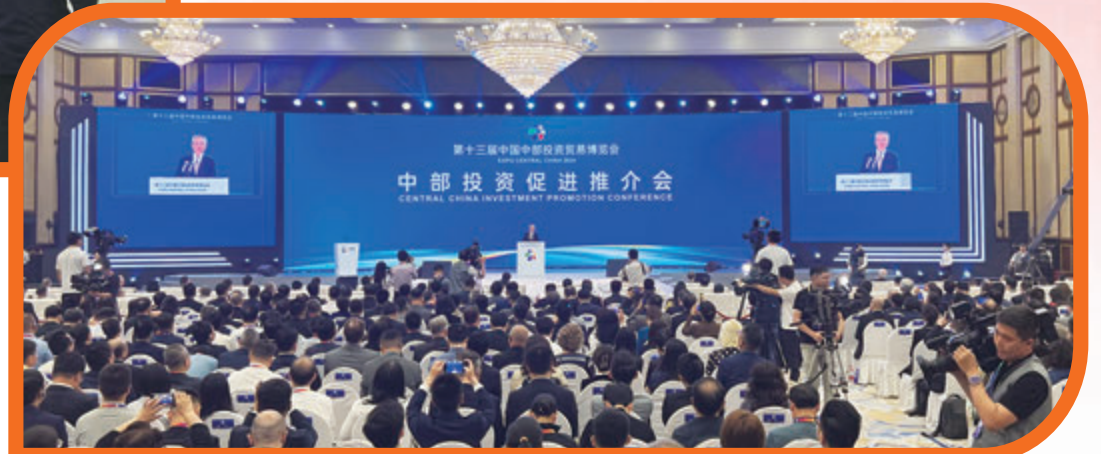
◆第十三屆中國中部投資貿易博覽會中部投資促進推介會現場。

5月31日至6月2日，第十三屆中國中部投資貿易博覽會（下稱「中部博覽會」）拉開帷幕。湖南省委書記沈曉明表示，習近平總書記今年3月到湖南考察並主持召開新時代推動中部地區崛起座談會，最近召開的中共中央政治局會議審議《新時代推動中部地區加快崛起的若干政策措施》，為在更高起點上深入實施中部地區崛起戰略提供了重大機遇、注入了強勁動力。在這個特殊的時間節點舉辦的第十三屆中部博覽會，必將大力推動中部地區與各方合作邁上新台阶，在「雙向奔赴」中實現互利共贏。