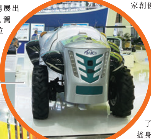
◆現場展出的無人駕駛拖拉機。