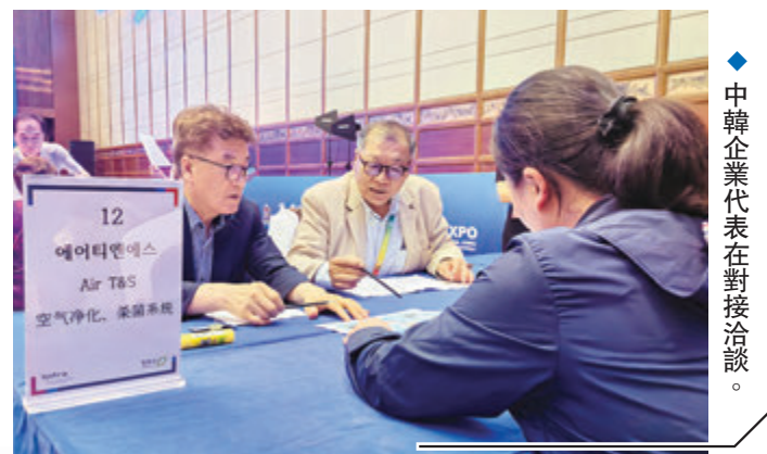
◆中韓企業代表在對接洽談。

香港和湖南經貿關係密切，香港不但是湖南最大的外資來源地，也是湖南的重要經貿夥伴。據了解，香港在湖南的投資涵蓋多個領域，包括基礎設施建設、金融服務、文化旅遊、科技創新等。同時，香港也是湖南的第二大交易夥伴，湖南與香港進出口額從2018年的441.6億元提升至2023年的592.6億元，增幅7.2%。