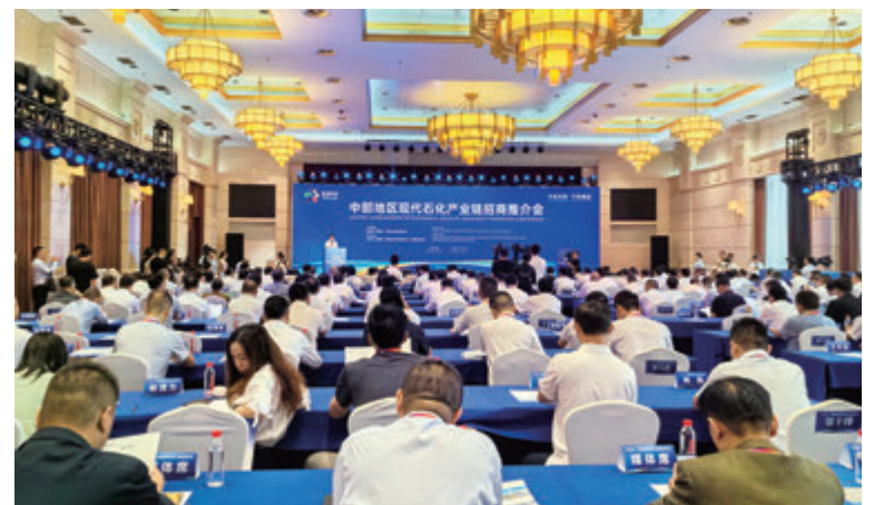
◆中部六省現代石化產業鏈重點企業、商協會、行業專家共話現代石化產業未來。

往為大家保駕護航，讓廣大投資者在湘人才有保障、服務有環境、投資有回報、發展有前景。