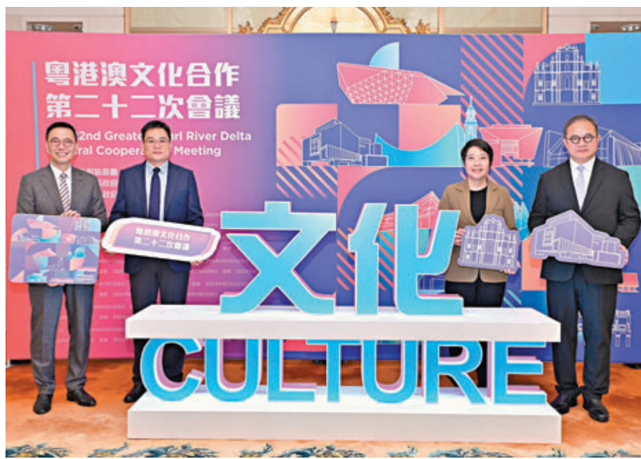
◆文化體育及旅遊局統籌的粵港澳文化合作第二十二次會議昨日在香港圓滿舉行。

由香港特區政府文化體育及旅遊局統籌的粵港澳文化合作第二十二次會議昨日在香港圓滿舉行，特區政府文化體育及旅遊局局長楊潤雄總結會議時表示，今年的會議成果豐碩，多個合作項目得到良好的進展，令人鼓舞。他期望透過這個會議的高層次框架為三地文化交流合作提供指導，並將合作的深度和廣度提升至更高的層次。香港作為中外文化藝術交流中心，將繼續善用在「一國兩制」下背靠祖國、聯通世界的獨特優勢，全力參與推動粵港澳的文化交流和合作，在「共建人文灣區」的同時，三地攜手開拓國際市場。廣東省文化和旅游廳廳長李斌表示，明年粵港澳合辦全國運動會是個契機，能繼續深化文化、旅遊及體育融合發展，傳承、宏揚及「說好大灣區故事」，提升大灣區的旅遊影響力，可與抖音、小紅書等新媒體合作，展示三地的文化藝術精品。 ◆香港文匯報記者 吳健怡