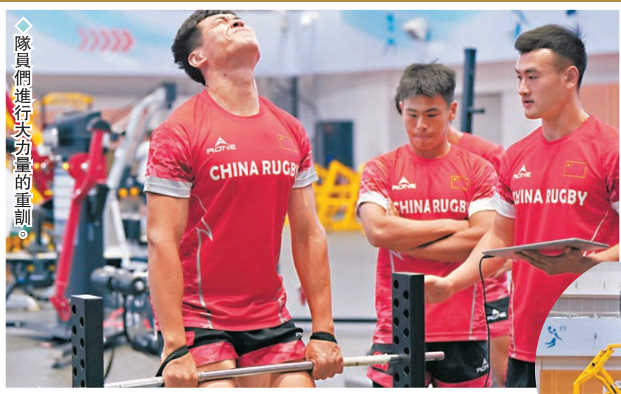
隊員們進行大功量的重訓。

七人欖球在2016年才首次成為奧運項目,亞洲球隊未能透過資格賽出線奧運便需要轉戰遺材賽,這項賽事在6月底舉行,除了有球迷熟悉的港隊外,亦有國家欖球隊出戰。中國欖球項目雖然起步較遲,不過近年發展卻非常迅速,女子隊已處於亞洲頂尖之列,而