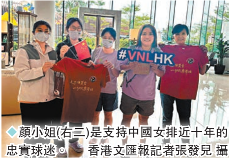
顏小姐(右三)是支持中國女排近十年的忠實球迷。

婷:「中國女排最吸引我的是她們獨有的精神,記得2016年里約奧運時她們在不被看好的情況下排除萬難奪金,令我十分感動,今次香港站當然希望中國女排順利取得奧運資格,不過最重要是她們都能健康和開心,無論成績如何,我都會支持中國女排。」