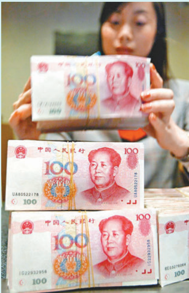
◆5月末中國外匯儲備規模為32,320億美元，較4月末上升312億美元。

數據公布後，現貨金下跌，最新下跌2.36%，報每盎司2,316美元。此前，地緣政治和經濟不確定性推動的避險需求，促使金價在3月至5月期間勁升，現貨金價在5月20日達到創紀錄的每盎司2,449.89美元。此前瑞銀集團預計，將黃金年底價格預期上調至2,600美元/盎司，建議在2,300美元/盎司附近或以下逢低買入。