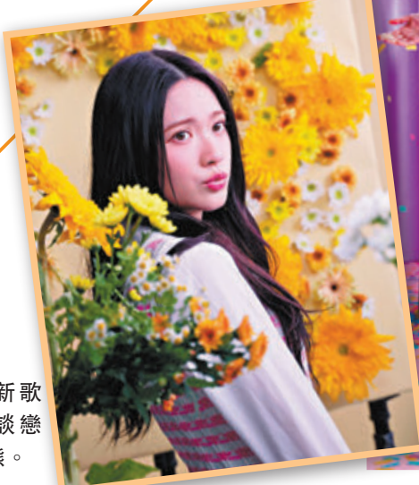
◆雲浩影新歌描述少女談戀愛時的狀態。