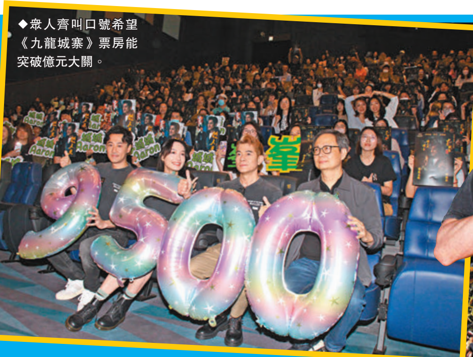
◆眾人齊叫口號希望《九龍城寨》票房能突破億元大關。

香港文匯報訊(記者 達里)郭富城(城城)、林峯與蔡思韻「一家三口」昨日首度合體到戲院為港產電影《九龍城寨之圍城》進行謝票,電影香港票房截至昨日3時有9,570萬港元,眾人齊叫口號希望票房能突破億元大關。患有先天性心臟病的「小鐵漢」Kansas剛巧也入場欣賞電影,他更以片中郭富城的「殺人王陳占」造型亮相,與一眾主演合照留念。