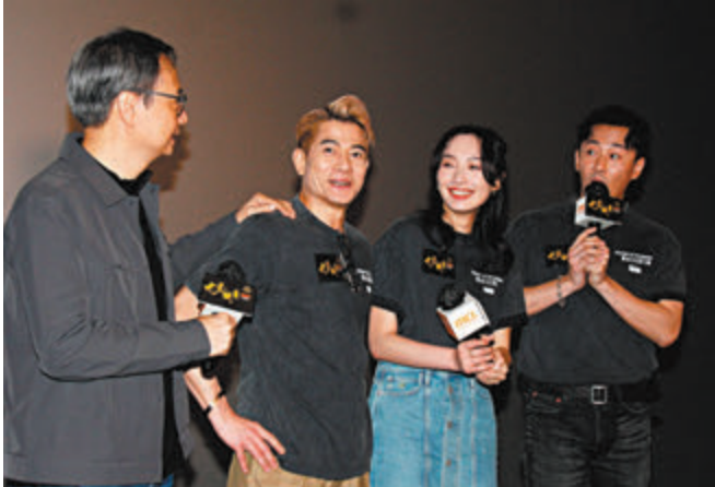
◆城城都想知道與戲中太太的感情是如何產生,又怎樣會有林峯這位兒子。