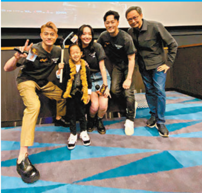
◆「小鐵漢」Kansas以片中郭富城的「殺人王陳占」造型亮相。