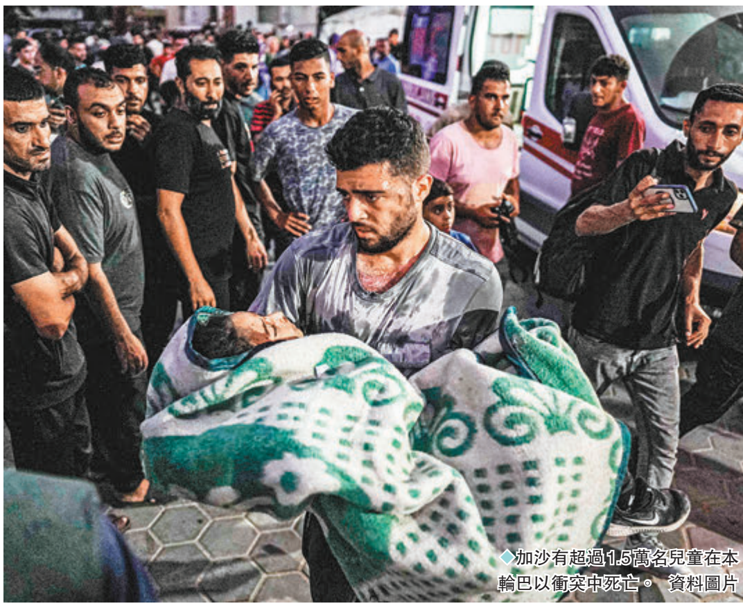
◆加沙有超過1.5萬名兒童在本輪巴以衝突中死亡。資料圖片

巴勒斯坦對此表示歡迎，巴教育部周二稱，加沙已經有超過 1.5 萬名兒童在本輪衝突中死亡，大多數兒童都遭受嚴重的心理創傷，且健康情況不佳。另據哈馬斯媒體辦公室周六發表