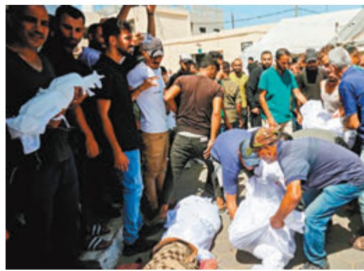
◆加沙中部逾210名巴人死亡。網上圖片

香港文匯報訊 以色列常駐聯合國代表埃爾丹周五(6月7日)搶先通過社交媒體稱，他被正式告知，聯合國秘書長古特雷斯在一份年度報告中，將以色列國防軍列入「全球侵犯兒童罪犯名單」。雖然被列入名單不會給以色列帶來任何直接後果，但可能會產生政治和外交影響，使以色列進一步受孤立於國際社會。