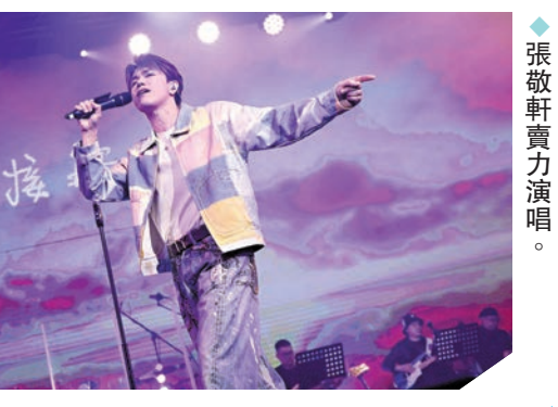
◆許志安與芷珊到訪機構探望貓咪。