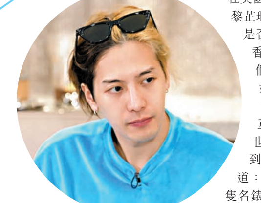
◆王嘉爾希望做出成績證明自己。

千嬅於中段登場演唱陳奕迅的《傷信》，但咪高峰又再度無聲，由於千嬅的耳機沒有問題聽到音樂，所以不知情下如常照唱，要觀眾示意才知出了問題。她淡定說：「難得回到香港唱歌，沒理由不重唱！」擁有豐富舞台經驗的千嬅事後談及咪高峰失靈，笑道：「小菜一碟！唱唔到看到觀眾不停向我揮手，還覺得很好，很开心、很安慰，及至突然衝個人出來說咪高峰沒聲要換才知，哈哈。」她又指很开心再次在港唱歌，亦希望舉行香港站