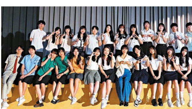
◆丁噹和學生們在禮堂過足畢業癮。

香港文匯報訊 丁噹睽違5年發行第11張粵語專輯《日與夜，跟自己說晚安》霸佔13榜冠軍，其中與陳華合唱的〈致遠道而來的我們〉也是專輯中YouTube發燒音樂之一，深受喜愛，尤其是歌詞中提及「曾經一個人到兩個人，握起手致遠道而來的我們」「跟世界對抗、還好溫柔的你在身旁」，描述相互鼓勵、互相安慰、彼此慰藉的情誼，深受學生喜愛。在畢業季到來時，丁噹邀請學生同唱，與30位學生共演，得知她想法的呂思緯（鼓鼓）立馬抽空，熱心地參與配唱製作，共同將這首歌賦予深厚友情的畢業之歌。