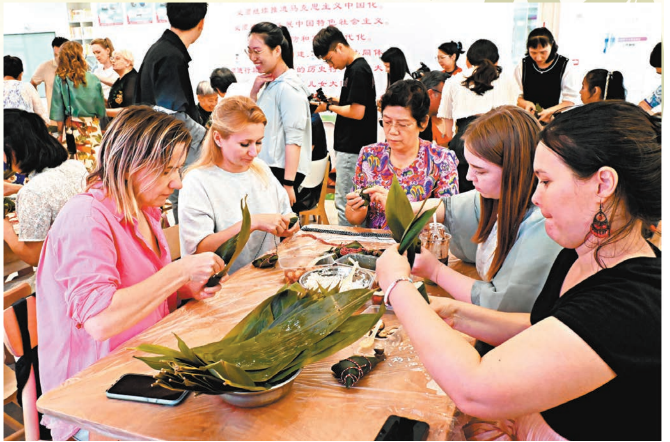
◆在深圳的外籍友人體驗中國端午包糉子的傳統習俗。

6月10日，由深圳市南山區人民政府主辦的「第六屆大沙河龍舟邀請賽」在南山區大沙河長廊盛大舉行。在參賽的25支龍舟隊中，由來自德國、英國、美國、意大利、瑞典、巴基斯坦、巴西、菲律賓等11個國家的外籍友人組成的「精彩蛇口國際友人隊」頗為吸睛。