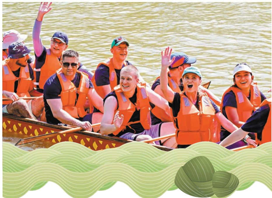
◆外籍友人們登舟待發。