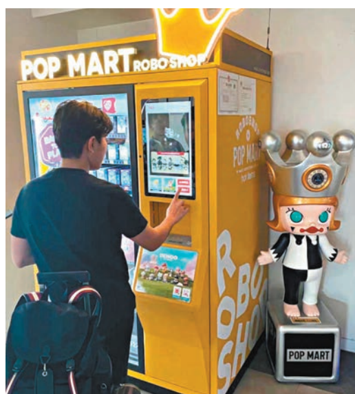
◆泰國國會議員在中國的泡泡瑪特自動售賣機上為女兒挑選禮物。