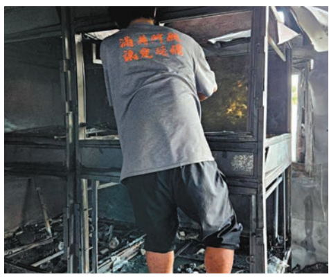
◆動物組織派員接收遺體。

香港文匯報訊(記者 蕭景源)石崗一間鐵皮屋昨日上午疑因冷氣機短路起火，火勢猛烈，大量濃煙席捲半空，消防員到場灌救約1個半小時才將火救熄。事件雖無人受傷，惟火場內多籠至少71隻貓慘遭活活燒死，部分燒焦的貓屍更被燒熔的玻璃包住，慘不忍睹。有動物組織已將貓屍交由寵物善終公司，由於涉及的貓屍數量驚人，相信會進行集體火化，「願貓貓們到彩虹橋後再無痛苦。」