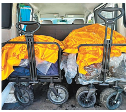
◆貓屍將交由寵物善終公司善後。

生前被因多個玻璃櫃及貓籠 現場為金水南路近錦上路157號的一間面積約700呎的單層鐵皮屋，上址連花園合共約3,000呎至4,000呎，不排除以前是用作舉辦寵物派對的場地，但至早前業主已將場地借予朋友用作收養流浪貓，鐵皮屋內放有大量玻璃櫃及貓籠。