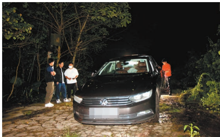
◆警方前晚在八鄉尋獲涉案私家車並在車廂內發現血漬和一支電槍。

由於事件不尋常，案件交由新界北總區重案組第1A隊暫列作「有人昏迷及送院時死亡」案調查，設法追查涉案私家車及可疑男子下落。與此