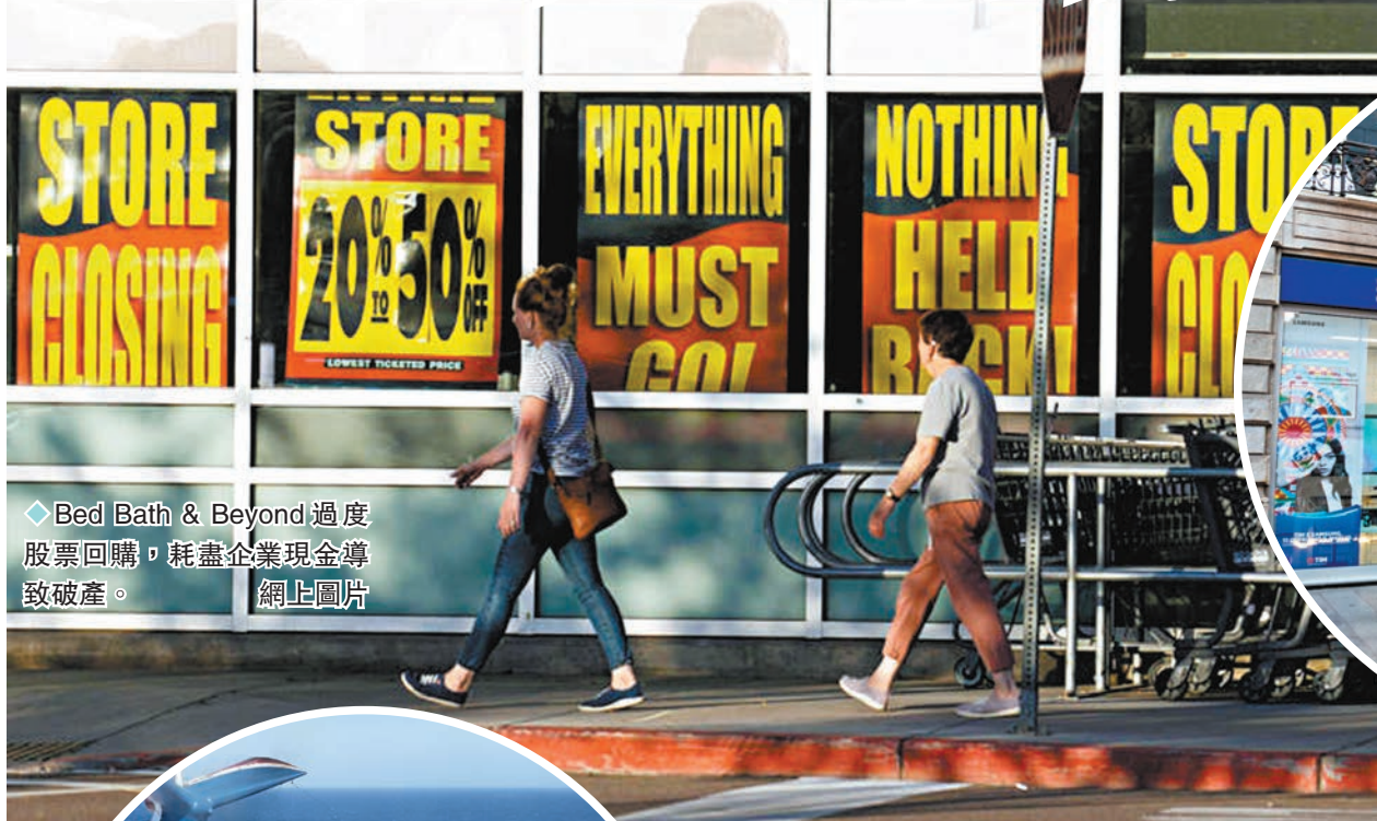
◆Bed Bath & Beyond過度股票回購，耗盡企業現金導致破產。

報告最後警告稱，全球各大殭屍企業到今年9月，預計要償還1.1萬億美元(約8.6萬億港元)貸款，是它們今年到期貸款總額約三分之二。美國投資企業Penn Mutual Asset基金經理希波羅尼稱，「如果全球央行利率維持現時水平，殭屍企業無法償還貸款和利息，遊戲便告結束。」