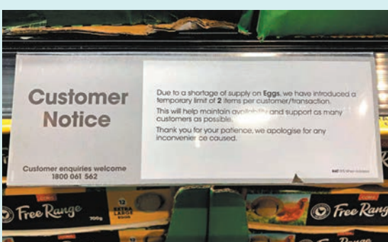
◆Coles貼出限購雞蛋告示。

維多利亞州農民聯合會表示，現時州內每16隻母雞中就有一隻被撲殺，每日的雞蛋供應量減少約45萬隻。