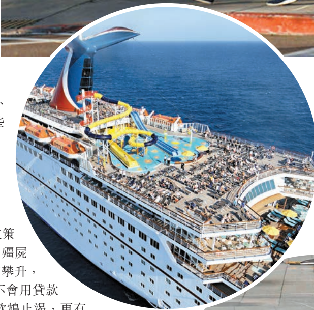
◆殭屍企業涵蓋多個領域，包括嘉年華郵輪公司(上)及廉航JetBlue(下)。