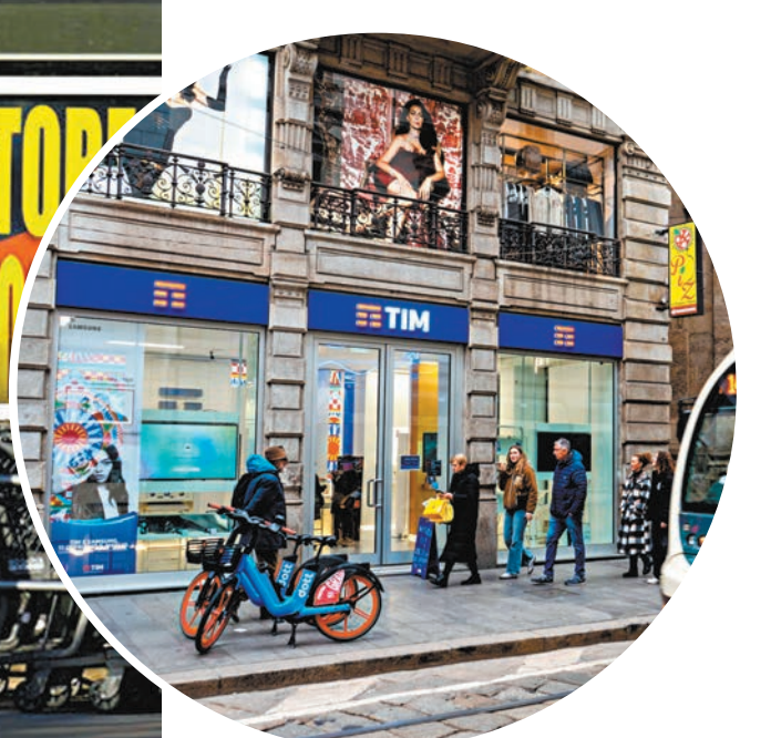
◆全球殭屍企業增加近三成，意大利電訊集團是其中之一。