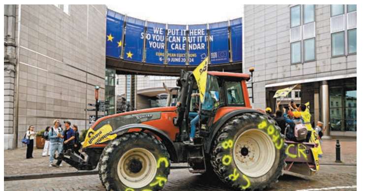
歐洲農民在選舉時間開車到歐議會建築前抗議。

隨著歐洲議會內疑歐論者增加，歐盟擴大成員或面臨挫折。商業風險分析集團Verisk Maplecroft分析師畢卡斯基說，雖然擴張政策在紙上仍維持積極性，但許多成員國的政治意願薄弱和國內政壇民族主義抬頭，不利下屆歐盟委員會接受新成員，「考慮所有候選國入盟談判進展緩慢，預計2029年歐盟成員數目依然在27個。」