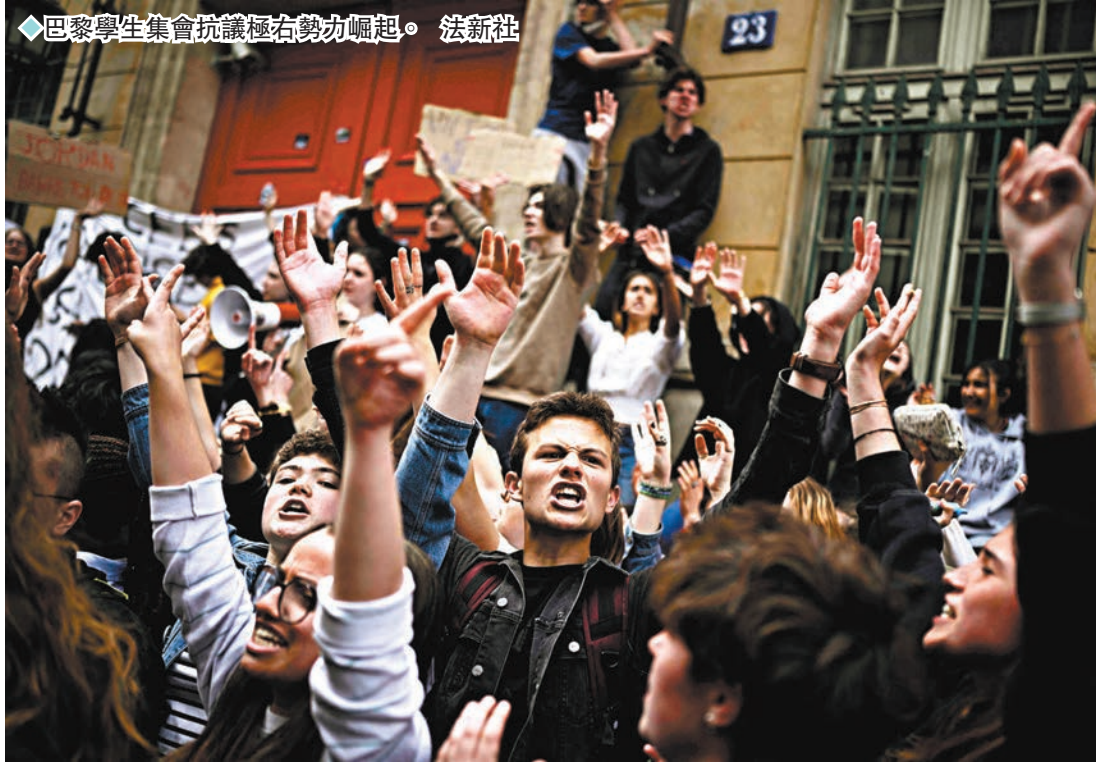
巴黎學生集會抗議極右勢力崛起。

香港文匯報訊 歐洲議會選舉結果周一(6月10日)起陸續公布，極右勢力在全歐多國均有進賬，呈現穩中向右趨勢。法國總統馬克龍(圖)和德國總理朔爾茨所屬政黨，均在選舉中不敵極右在野黨，歐盟委員會主席馮德萊恩領導的中間偏右歐洲人民黨(EPP)黨團，預計仍會領導親歐中間派維持歐議會過半數議席。面對選舉失利，馬克龍周日晚宣布解散國民議會(國會下議院)，提前本月底舉行國會選舉，試圖押注其政治生涯，打擊極右勢力冒起。