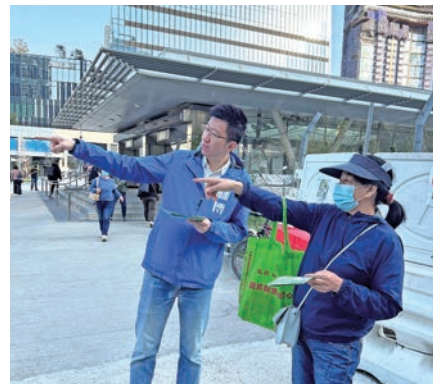
◆林博傾力為地區服務，派發綠色集體運輸系統意見調查，定期與居民全接觸。