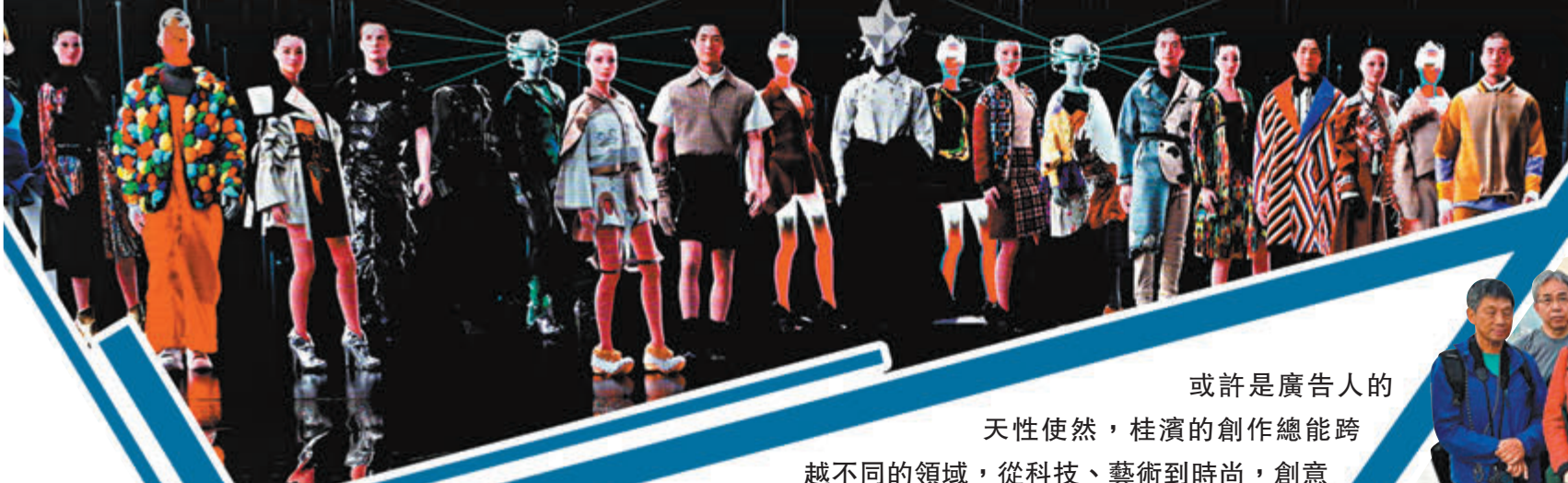
◆桂濱享受在海上自由航行的感覺。受訪者供圖

◆全港首個虛擬時裝秀及互動展覽 JUXTA-POSED 2022 FASHION META。受訪者供圖