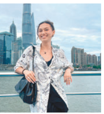
◆漢娜·羅斯在黃浦江遊輪上遊覽上海美景。