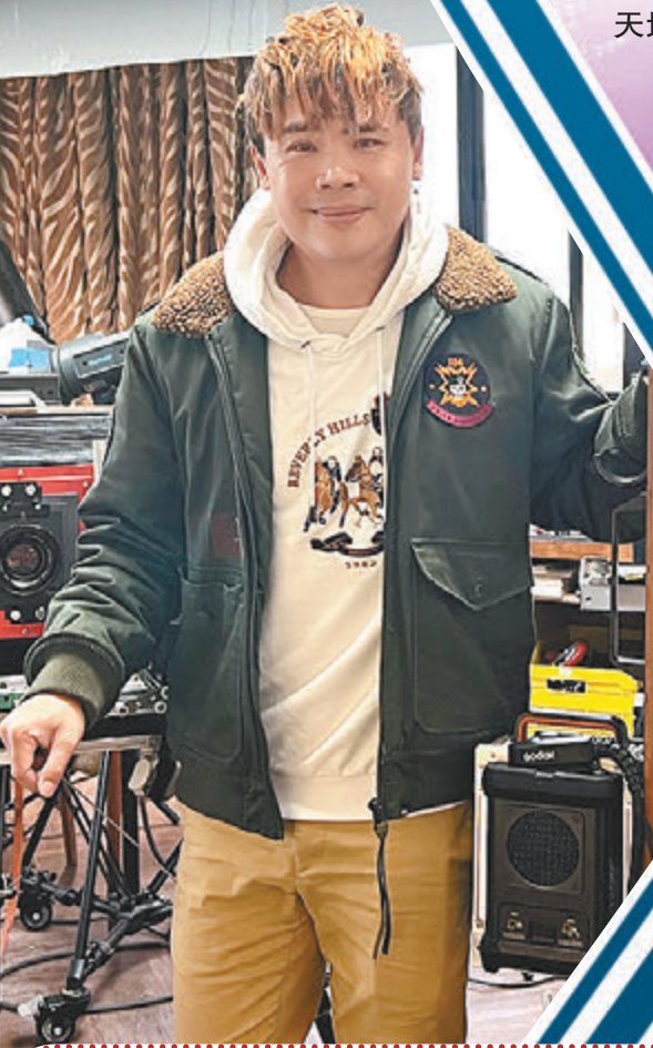
▲桂濱榮獲2023香港資訊及通訊科技獎之數碼娛樂大獎及數碼娛樂(互動設計)金獎。