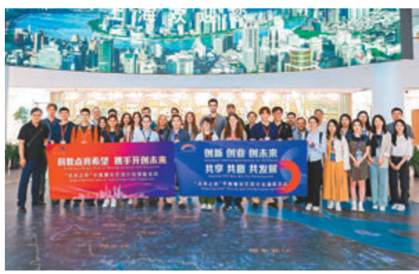
◆今年「未來之橋」中美青年交流計劃旗艦活動上海之行本月拉開帷幕。