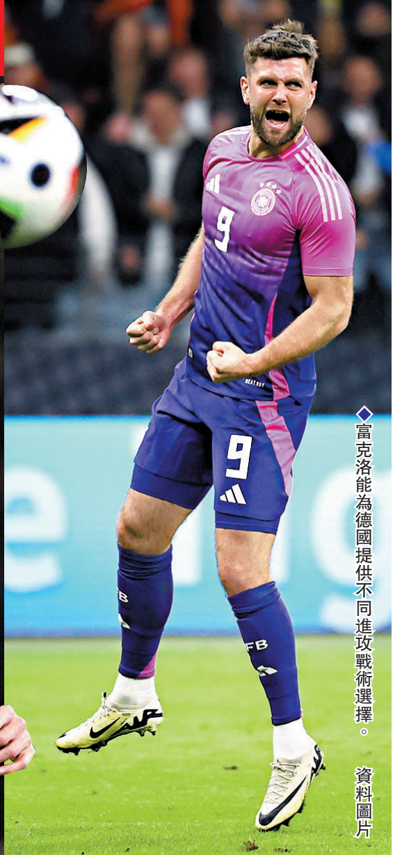
富克洛能為德國提供不同進攻戰術選擇。資料圖片