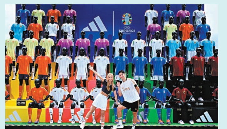
K11 MUSEA設置的「巨型打氣看台」勢將成為新的熱門打卡位。

歐國盃掀起的足球狂熱席捲全港，啟德AIRSIDE由即日起至7月13日將舉行名為《最強十二人》的活動，從文化、藝術及娛樂等多角度出發讓市民感受這股足球熱潮，活動期間除了有快閃店出售主題紀念品及復古球衣外，更展出24件從上世紀八十年代到近代的球衣，向市民講述24個決賽周球隊故事，而最引人注目的莫過於現場搭建的全港首個商場室內2vs2仿真足球場，未來一個月將舉辦多場不同球賽及工作坊，並設有英國著名藝術家Jack Sachs的大型3D藝術裝置，以及多款足球體驗遊戲，滿足市民的打卡需要之餘，更可親自落場展現球技。