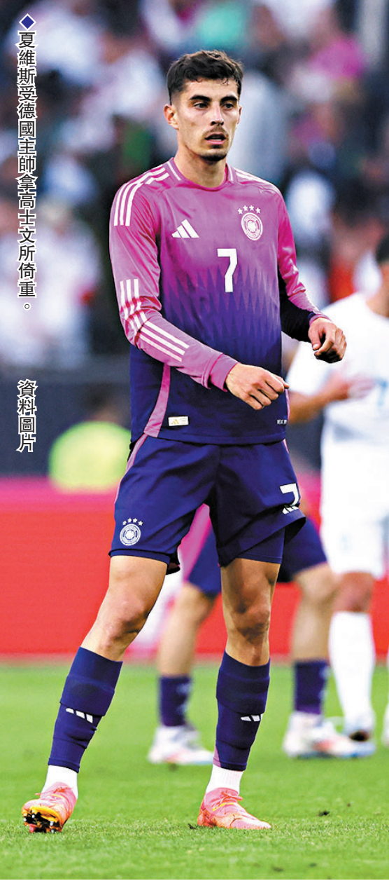
夏維斯受德國主帥拿高士文所倚重。

經過連續兩屆世界盃小組賽出局後，德國今屆歐國盃終於痛定思痛進行大刀闊斧的改革，首先是起用年僅36歲的拿高士文擔任主帥，這位少帥向來崇尚進攻，他亦坦言希望以悅目的進攻足球重新獲得球迷的支持：「我希望看到球迷在大街小巷中為德國隊表現歡呼喝采，這是我和我團隊的責任，我們想成為一支能夠取悅球迷的球隊，特別是德國球迷，我所嚮往的足球不僅能帶來勝利，更要悅目和進取，我們會嘗試製造大量射門機會。」事實上在大賽中的屢屢失利，德國球迷對國家隊的支持度亦跌至新低，主辦歐國盃作為德國近20年來最大的體育盛事，在一項民意調查中竟有多達27%的受訪者表示不感興趣，表示非常感興趣的只有43%，德國在今屆歐國盃表現好壞，甚至會影響德國足球的未來發展。