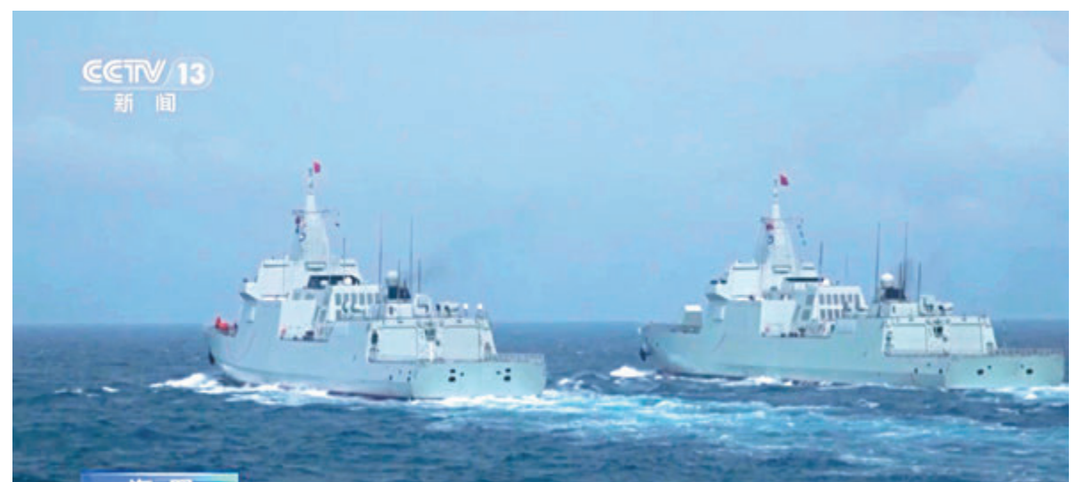
◆中方敦促美方認清「台獨」分裂勢力的野心和危害，切實恪守不支持「台獨」的承諾。圖為近日，解放軍萬噸大驅赴南海某海域晝夜礮兵。

有記者問，據報道，賴清德近日視察台東「海鋒大隊」與「雄3」導彈車合影，表示要「以陸制海」對抗解放軍。台防務部門負責人稱，若解放軍進入台島12海里內對台「海空域」構成威脅時會行使「自衛權」。請問對此有何評論？