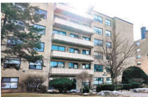
◆加拿大房價持續上升，國民愈來愈難負擔。

示威者晚上繼續把家具從大樓內搬出來，直至周四凌晨1時多，大部分示威者才陸續離開大樓，返回他們在校園內另一區域的營地。這次佔領事件中無人受傷及被捕，但有員工和學生舉報有人被毆打，不排除有執法行動。校內的面授課堂及活動將改成線上進行，直至另行通知。