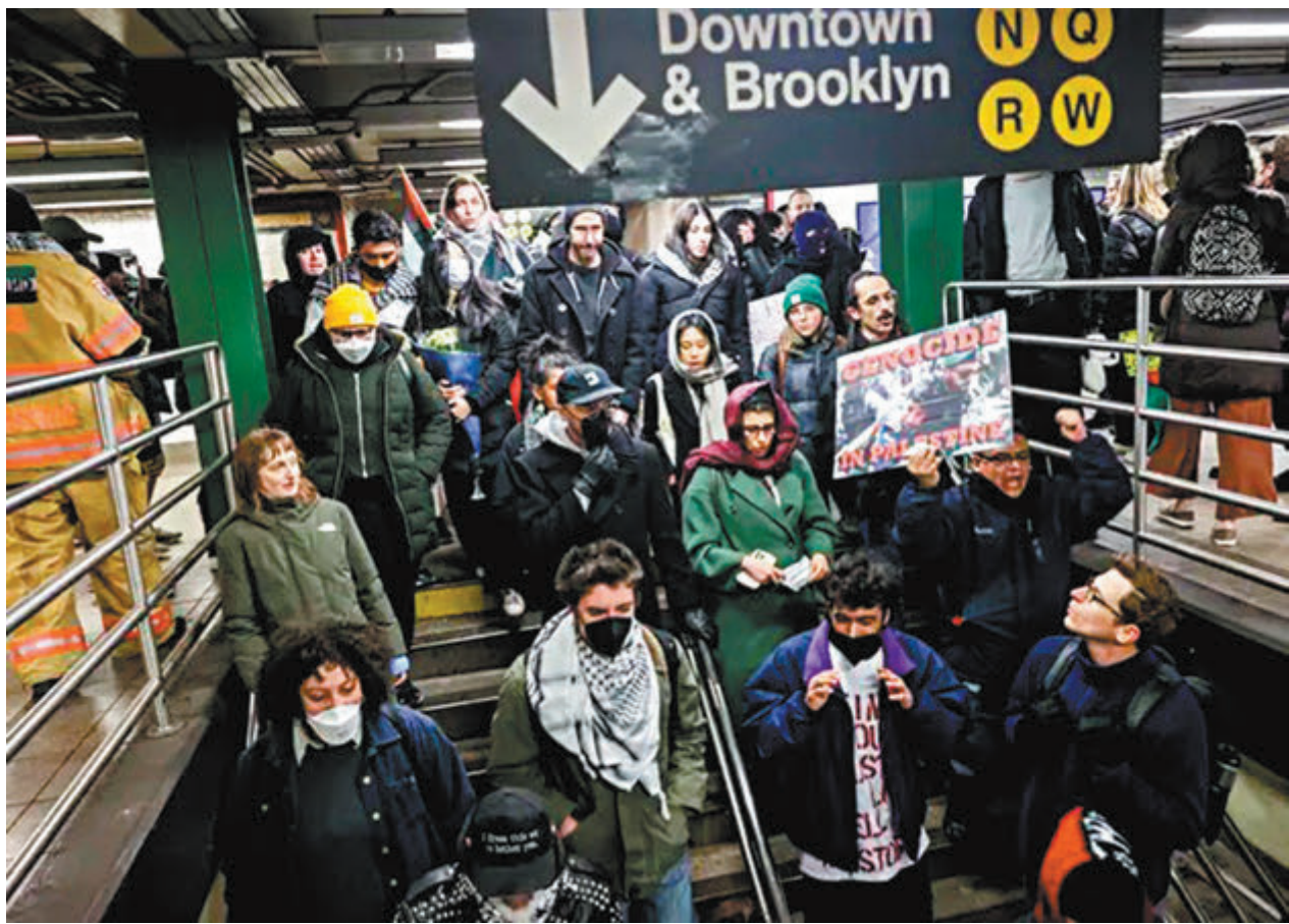
◆紐約州因應反猶太主義活動增加，考慮在地鐵重推「禁蒙面法」。圖為援巴人士在紐約地鐵舉牌抗議。網上圖片

香港文匯報訊 美國聲援巴勒斯坦示威浪潮持續，紐約州因應近日反猶太主義活動增加，考慮在地鐵重推「禁蒙面法」，以阻嚇企圖用戴口罩等蒙面方式隱藏身份人士犯罪。此舉令人聯想2019年香港黑暴期間，蒙面示威者行為愈趨激烈，包括投擲汽油彈，向持不同政見的市民動用私刑，香港政府通過《禁止蒙面規例》遏止暴行，卻遭到美西方政客的抹黑，試圖為暴力示威者「撈腰」，如今紐約州欲重推「禁蒙面法」打壓反巴活動，明顯是雙重標準的行為。