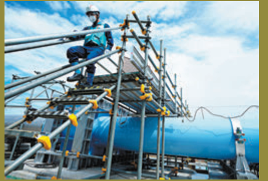
◆福島第一核電站發生員工死亡事件，東電否認與工作有關。資料圖片

香港文匯報訊 美國聲援巴勒斯坦示威浪潮持續，紐約州因應近日反猶太主義活動增加，考慮在地鐵重推「禁蒙面法」，以阻嚇企圖用戴口罩等蒙面方式隱藏身份人士犯罪。此舉令人聯想2019年香港黑暴期間，蒙面示威者行為愈趨激烈，包括投擲汽油彈，向持不同政見的市民動用私刑，香港政府通過《禁止蒙面規例》遏止暴行，卻遭到美西方政客的抹黑，試圖為暴力示威者「撈腰」，如今紐約州欲重推「禁蒙面法」打壓反巴活動，明顯是雙重標準的行為。