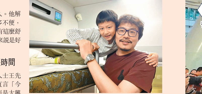
◆朱先生父子在二人包廂裏度過一個溫馨父親節。