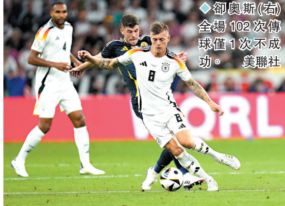
◆卻奧斯(右)全場102次傳球僅1次不成功。

德國隊今場另一大功臣必然是卻奧斯，雖然這位34歲的中場表明今屆賽事後退役，不過他今場表現卻寶刀未老，堪稱大師級，102次傳球僅傳失1次，成功率高達99.9%。德國在中場佔盡優勢下取得這場歐國盃史上最大分差的揭幕戰勝利，就連蘇格蘭隊長安德魯羅拔臣亦坦承球隊是輸在卻奧斯腳下：「我們沒有對卻奧斯施加足夠壓力，他幾乎決定了一切，他擁有可能是全世界最好的傳球能力，但我們卻讓他踢得太輕鬆。」