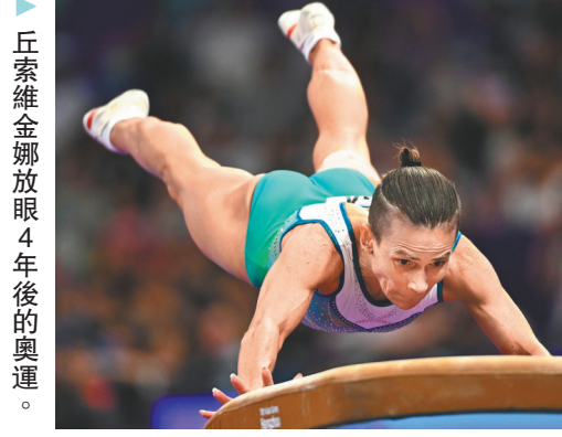
▲丘索維金娜放眼4年後的奧運。

據國際體操聯合會13日消息，即將年滿49周歲的烏茲別克斯坦體操名將丘索維金娜未獲得資格，無緣亮相巴黎奧運會。