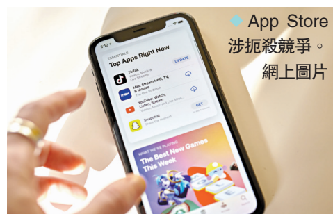
App Store 涉扼殺競爭。網上圖片

全球營業額5%的罰款。除了涉及蘋果應用程式商店的操作問題外，歐委會下一步將評估蘋果語音輔助系統Safari是否符合DMA規定。此外，消息人士稱Meta也會因其收費操作模式，被歐盟控告違反相關法例。 消息人士表示，歐盟委員會目前僅得出初步調查結果，蘋果仍可能採取行動糾正其做法，這可能導致歐委會重新評估任何最終決定，而作出宣布的時間也可能更改。