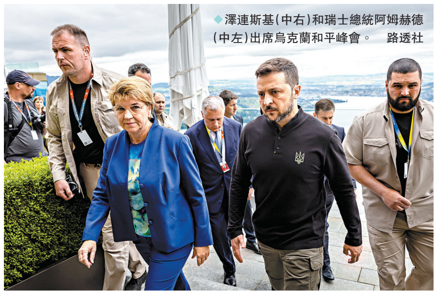
澤連斯基(中右)和瑞士總統阿莫赫德(中左)出席烏克蘭和平峰會。

香港文匯報訊 烏克蘭總統澤連斯基過去兩周穿梭菲律賓、沙特阿拉伯、新加坡、卡塔爾和意大利，尋求各方支持對俄施壓，促使俄接受烏方的停火談判條件。然而他的外交努力不但未能讓各方團結，反而揭露各國分歧，《華爾街日報》指出，早前在意大利舉行的七國集團(G7)峰會上，各國領袖在口頭上和金錢上挺烏，但未有提出澤連斯基尋求的安全保障。