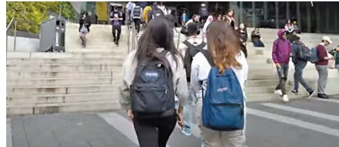
年輕人易受引誘，不自覺地迷上網上賭博。

自從安大略省在2022年4月率先把網上博彩市場合法化後，網上賭博廣告數量大增，並且盛行以名人和運動員作為廣告的主角，宣傳各種體育博彩和賭博網站。直至2023年8月，安省酒精博彩委員會宣布禁止網上遊戲的廣告出現運動員。加拿大博彩協會主席伯恩斯表示，合法賭博網站有權賣廣告，須規定網站防止年輕人在這些網上建立賬戶和玩遊戲。