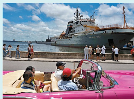
俄艦停泊在哈瓦那港。

今次是加拿大皇家海軍相隔約8年後再次到訪哈瓦那，俄方則指，只是在做其他國家都會做的事，不明白美方為何擔心，又指西方國家時常無視俄方透過外交途徑作出的警告，永遠要到俄方有「實際行動」，才肯認真回應問題。