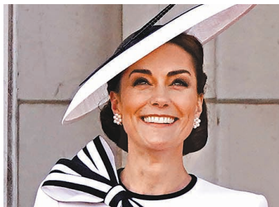
凱特在白金漢宮陽台亮相。

船與懸掛新加坡國旗的運油船，於周五下午在距離聖淘沙數公里外的碼頭發生碰撞，當局接到聖淘沙發展局及碼頭業者等通知，指巴西班讓碼頭、丹戎海濱、巴拉灣海灘和聖淘沙島的西樂索海灘出現大片油漬。 當局出動16艘緊急船隻噴灑消油劑，並清理水面上的浮油。海事局稱船隻漏油情況已受控，事故不影響航行交通，巴西班讓碼頭的船隻停泊運作也不受影響。 聖淘沙發展局表示，沙灘出現油漬後，局方已暫停所有海上活動，並與海事及港務管理局等單位合作，進行清潔工作，首要任務是降低漏油事件對水域和周圍野生動物造成的影響。在這段期間，遊客可以繼續使用海灘，但不能在海灘游泳和進行水上活動。