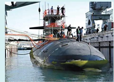
美「海倫娜」號抵關塔那摩灣。網上圖片