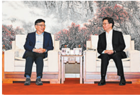
◆林世雄（左）與國鐵集團會面，商討如何進一步提升廣深港高速鐵路香港段的服務。

香港文匯報訊（記者 劉明）香港特區政府運輸及物流局局長林世雄搭乘高動臥昨早抵達北京西站，中國國家鐵路集團有限公司（國鐵集團）的代表在車站迎接，而他出席歡迎儀式後與國鐵