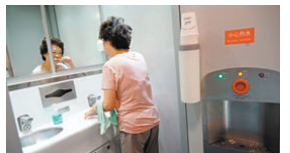
◆乘客洗漱整裝，準備迎接抵埠後的行程。

昨晨6時左右，不少乘客也懷着興奮的心情到洗手池前洗漱整裝，迎接北京之旅。6時53分，列車準時抵達北京西站，落車後映入眼簾的就是大屏幕上的歡迎標語「熱烈歡迎香港西九龍—北京西高動臥列車首發團抵京」。歡迎