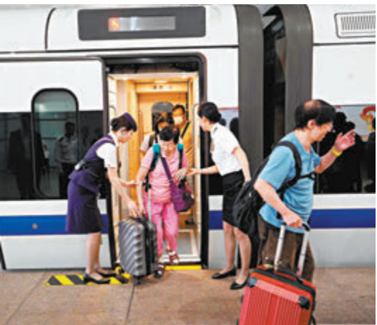
◆職員熱心體貼，協助年長乘客下車。

搭乘該班動臥列車到上海的香港特區政府運輸及物流局副局長廖振新表示，對能乘坐首發列車感到非常開心，「這是極具紀念性的事，我看到列車中很多乘客心情都很好，這趟列車備受乘客