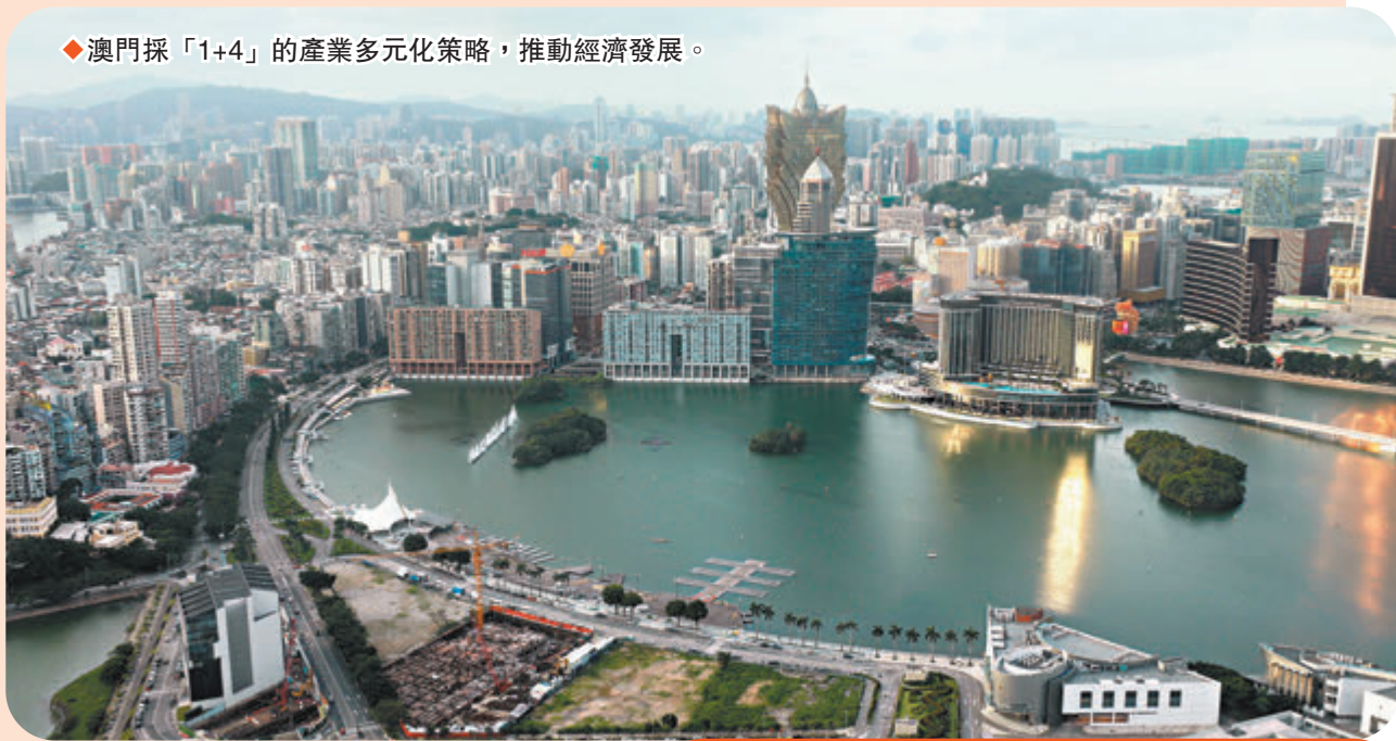
◆澳門採「1+4」的產業多元化策略，推動經濟發展。