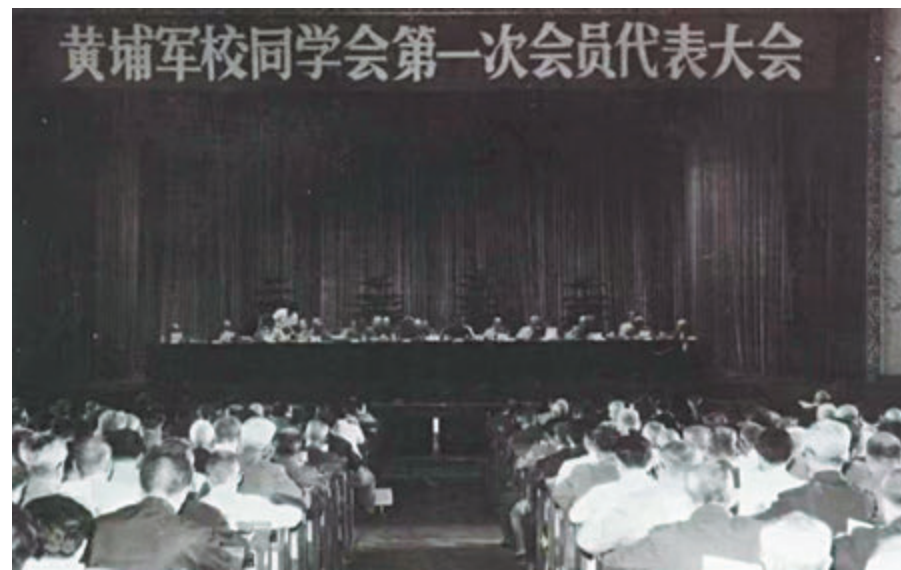
◆1985年，黃埔軍校同學會第一次會員代表大會在北京召開。 網上圖片

2014年9月26日，中共中央總書記習近平在會見由黃埔十六期生、台灣新同盟會會長許歷農率領的台灣和平統一團體聯合參訪團時指出，「中華民族偉大復興與兩岸同胞前途命運緊密相連。台灣的前途繫於國家統一，台灣同胞的福祉離不開中華民族的強盛」，「希望台灣同胞同大陸同胞一道，在推進中華民族偉大復興和實現國家和平統一的進程中，把握住機遇，相互扶持，緊密合作，為過上平安寧、幸福美好生活，為在世界上共享中華民族尊嚴和榮耀而攜手奮鬥」。 來源：中共中央統戰部網站