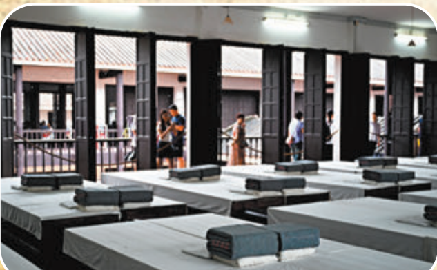
◆黃埔軍校學生宿舍場景復原。