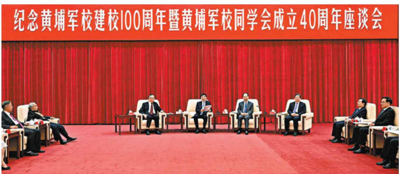
◆6月17日，紀念黃埔軍校建校100周年暨黃埔軍校同學會成立40周年座談會在北京舉行。中共中央總書記、國家主席、中央軍委主席習近平發來賀信，代表中共中央向黃埔軍校同學會表示熱烈祝賀，向廣大海內外黃埔同學及其親屬致以誠摯問候。會上宣讀了習近平的賀信。中共中央政治局常委、全國政協主席王滬寧出席並講話。

中央和國家機關有關部門、有關團體負責同志，有關民主黨派中央負責人，海峽兩岸、港澳和海外黃埔同學及親屬代表，省級黃埔軍校同學會負責人等參加座談會。