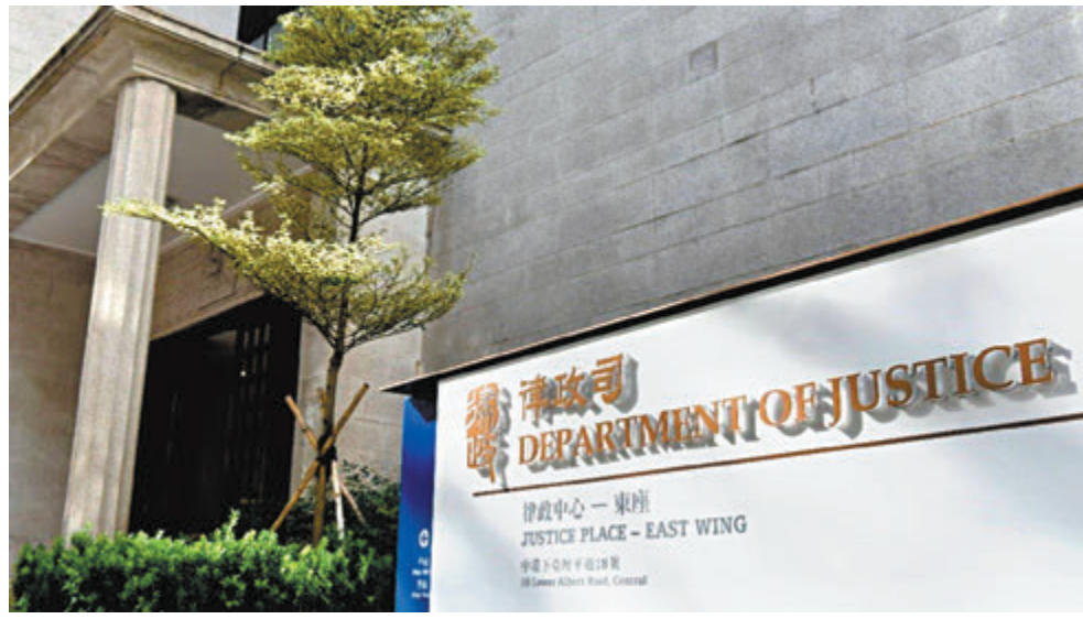
◆律政司刑事檢控科昨日發表《香港刑事檢控2023》年報，回顧去年的檢控工作。圖為律政中心。資料圖片

報告在分科一的「裁判法院」內容中指出，律政司除就影響市民日常生活的罪行提供法律意見及提出檢控外，亦負責處理與維護國家象徵及加強民族自豪感的法律有關的案件，並特別列舉了兩宗「污辱國旗（區旗）」及「污辱國歌罪」案