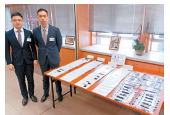
◆警方講述代號「孤燈」行動破獲涉以虛假資料提早提取強積金供款案件詳情。

體，收到自稱是中介或經紀的陌生來電或訊息，聲稱可幫助被捕人提早申請取回強積金供款，但需要提供其個人資料，事成收取一成至五成不等的佣金；亦有被捕人聲稱中介最初提出協助他們整合強積金，但過程中要求簽署不同文件，甚至在手機應用程式作人面識別程序，實際是用於開通虛擬銀行戶口，藉以騙取其強積金。