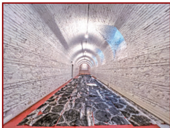
◆《牆與路》羅馬古道拓片，現於《時間的瞬間：徐冰在羅馬》展覽展出。 ◎徐冰工作室

中國當代藝術家徐冰，繼著名音樂大師譚盾後，在今年3月獲文化體育及旅遊局（文體旅局）委任為「文化推廣大使」，其中一項工作重點是培育香港年輕藝術人才。徐冰在意大利羅馬美國學院駐留及舉辦個人展覽期間，四位來自香港的大學生亦隨他到當地進行為期一個月的實習，協助創作作品和布展，藉此機會在國際藝術領域擴闊視野。