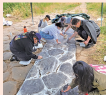
◆同學在羅馬古道的拓印工作。

徐冰表示，希望能夠為更多青年藝術人才提供支持與幫助，建構機會與平台，讓他們在藝術的道路上充分發揮自己的才華和創造力，不斷成長進步。