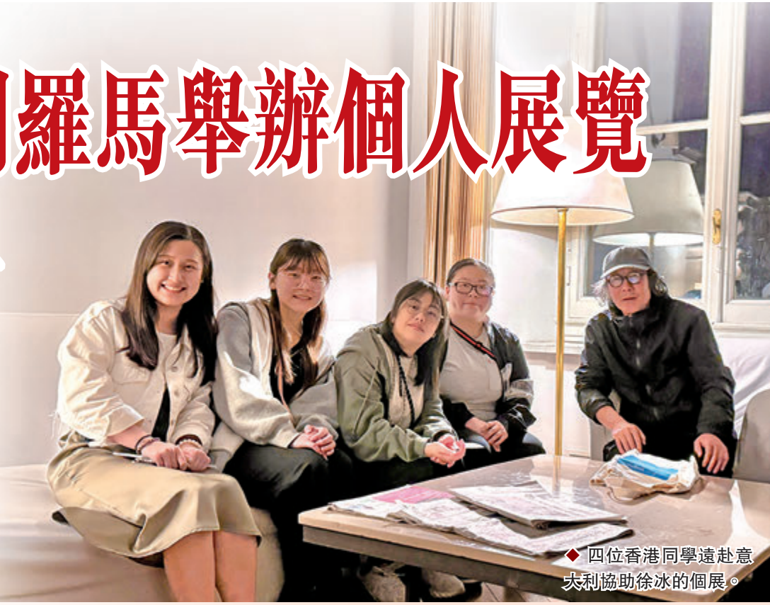
◆四位香港同學遠赴意大利協助徐冰的開展。

香港都會大學學生包麗怡談及徐冰對拓印技術的理解和運用，源自於他擅長把中華傳統元素融入當代藝術創作之中，