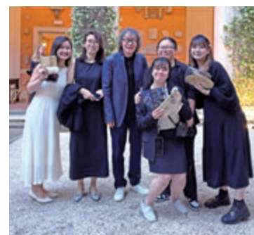
◆同學一起參與展覽的開幕會。

◆請掃描二維碼，重溫今年3月在港舉行的「藝術家分享會：徐冰——當代藝術與社會現場」