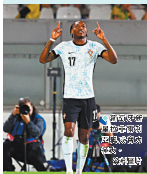
◆葡萄牙新星拉菲爾利亞奧威爾極力極矣。 資料圖片