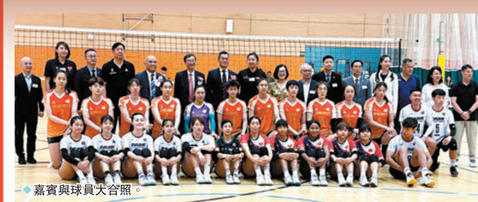
◆嘉賓與球員大合照。