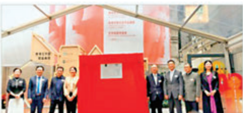
◆2024年5月27日，香港文學館於灣仔茂蘿街7號開幕，圖為主禮嘉賓為香港文學館進行揭牌儀式。

這屆香港政府一直致力於推動文化藝術的發展，並重視香港作為一個文化之都的地位。香港文學館的開幕是政府對文學事業的支持和投資資源的體現，是政府對香港文化傳承和創新的承諾，也體現出香港文化的自信和繁榮的風範。