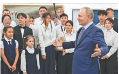
◆普京出發赴朝前，到訪俄遠東地區雅庫茨克。

美國對普京此行深化俄朝關係表示擔憂，美國國務院稱，「頗肯定」普京將就俄烏衝突向朝鮮尋求軍事援助。俄朝雙方均否認進行軍備轉移，但矢言加強軍事聯繫，包括可能進行聯合軍演。