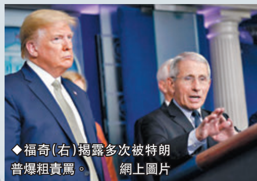
福奇(右)揭露多次被特朗普爆粗責罵。

福奇在書中寫道，第一次與特朗普見面是2019年9月，當天特朗普簽署行政命令要求流感疫苗製造商增加產量，不過特朗普私下對福奇說，出任總統之前不曾打過流感疫苗，「因為根本沒必要」。