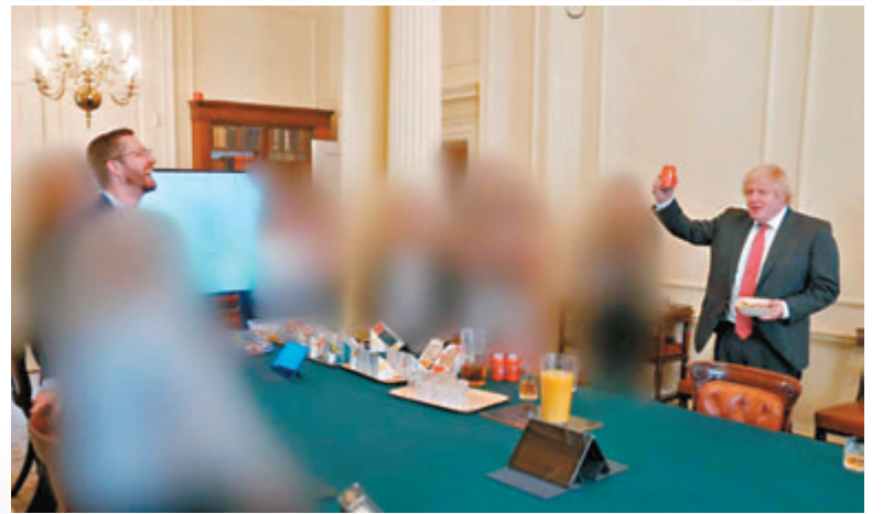
「派對門」事件激起民憤，抗議人士戴上約翰遜面具大肆嘲諷。網上圖片

回憶錄中指出，特朗普2020年6月致電福奇時破口大罵，因為福奇接受美國醫學會期刊訪問時坦承，新冠疫苗效力能維持多久仍不確定，可能每年需要再打疫苗。福奇的訪問見報後造成股市下跌，特朗普在電話中破口大罵福奇「害整個國家損失×××1兆美元(約7.8萬億港元)」。