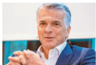
◆瑞銀集團行政總裁安思杰

瑞士因其獨特地理環境及以中立的政治立場，因而成為全球富人及投資者「避風港」，然而去年爆發瑞信危機後，瑞信吞併了瑞信「二合一」，亦動搖了市場對瑞士金融體系信心。市場觀望瑞士金融監管當局或以更嚴格的資本要求監管當地銀行免受破產風險拖累。