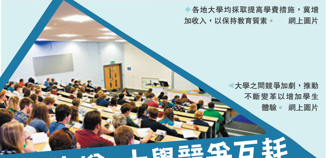
大學之間競爭加劇，推動不斷變革以增加學生體驗。網上圖片