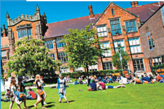
英大學失去大筆留學生收入來源。

英國大學愈來愈依賴海外學生的高昂學費以增加收入。然而英國留學生簽證變化，導致留學生申請人數大幅下降，大學失去大筆收入來源。英國大學校長表示，若要保持教育行業穩定，需要將學生每年學費增加2,000至3,500英鎊（約1.99萬至3.48萬港元）。