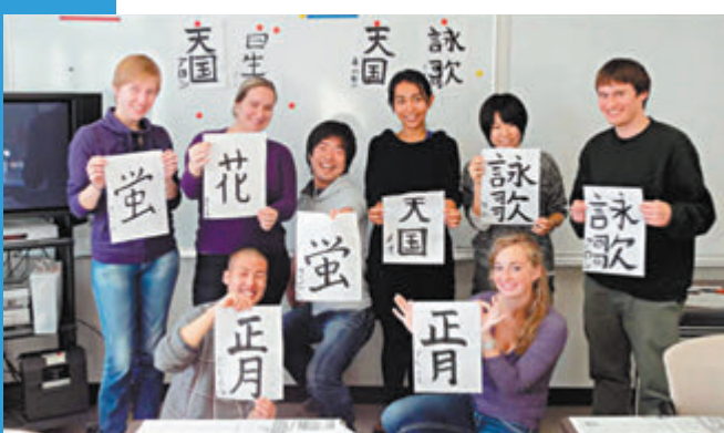
現時有逾20萬留學生在日本求學。

香港文匯報訊 日本媒體報道，日本政府授權86所國立大學對留學生的收費，從之前每年53.38萬日圓（約2.64萬港元），提高20%，增