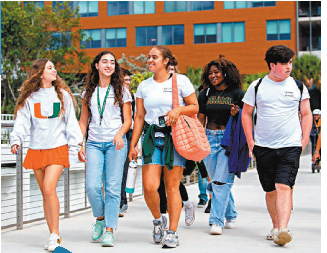
各地大學均採取提高學費措施，冀增加收入，以保持教育質素。

此外，日本政府目標到2033年提高留學生人數至40萬，相較2019年增加30%，並希望畢業生可以留日定居或工作。然而日本近年留學生人數持續下降，根據日本學生服務組織（JASSO）的資料，截至2022年5月1日，日本留學生總數達23萬，按年減少4.7%。